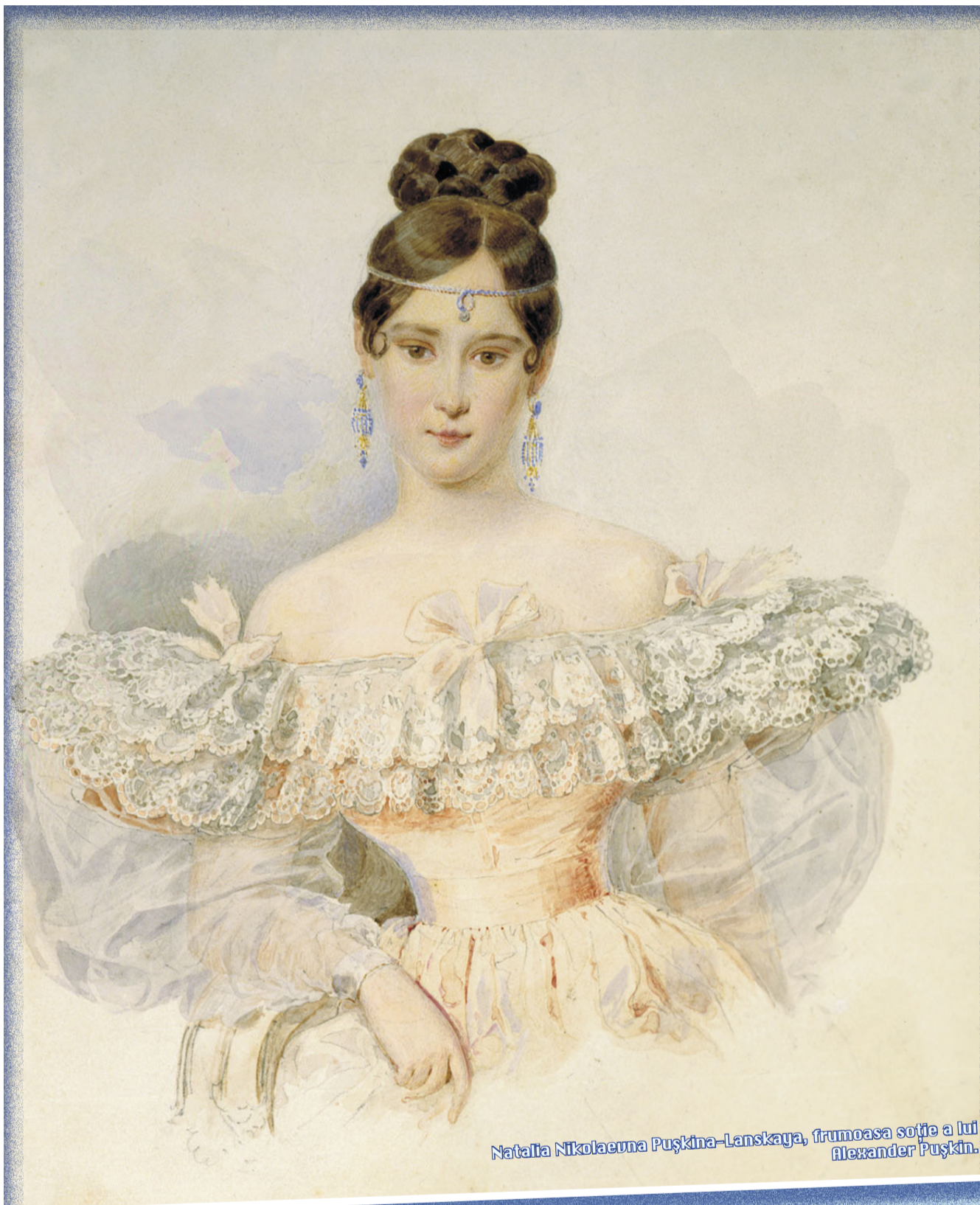
Natalia Nikolaeuna Puškina-Lanskaya, frumoasa soție a lui Alexander Puşkin.