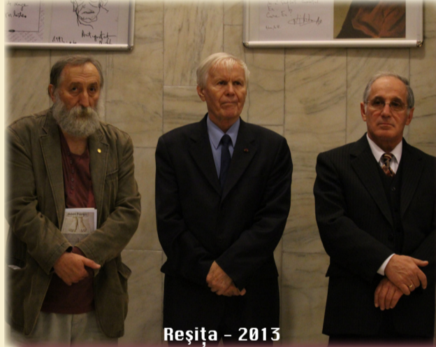
Reşiţa - 2013

Din „Odă”, am înţeles eu, că a muri este un act de curaj.