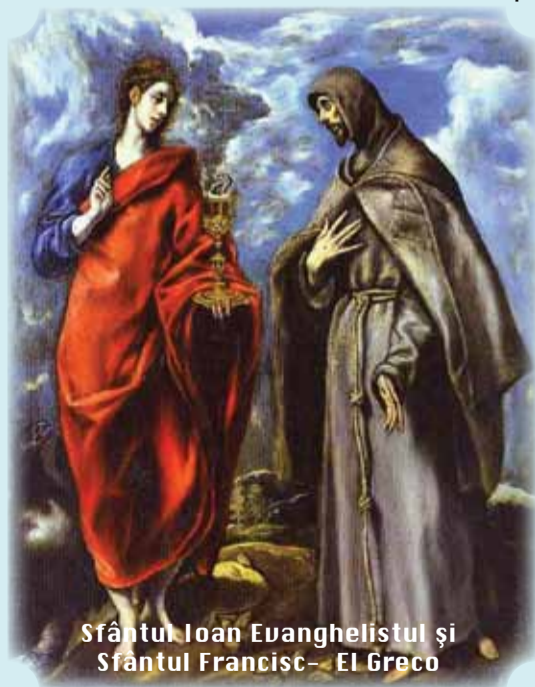
Sfântul Ioan Evanghelistul și Sfântul Francisc – El Greco

În această dezorientare și blocaj duhovnicesc și sobornicesc interesul național al tuturor românilor nu poate fi altul decât revenirea la origine, la refacerea unității religioase cu Roma. Dialogul început de Fericitul Ioan Paul II la București trebuie continuat. Mâna intimă a Occidentului în anii 1600, 1700, 1859, 1918, 2007 trebuie onorată. De unirea cu Roma depinde emanciparea națională și socială nu de paleativele practicate până acum.