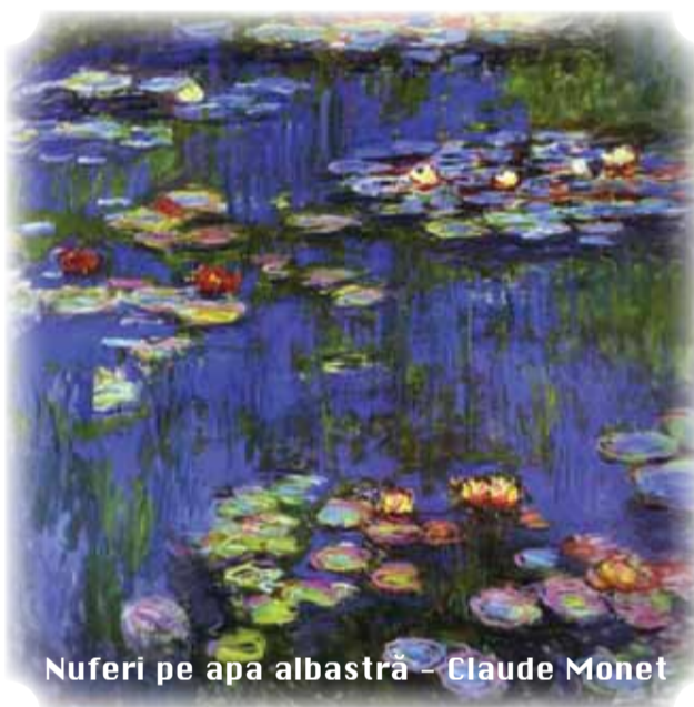
Nuferi pe apa albastră – Claude Monet

multiple în forma lor, au cel mai adesea criterii comune. Husserl, prin abordarea fenomenologică a psihologiei, analiza experiențelor altora, dar era la rândul său sursa unor înclinații mistice alături de cele ale secretarei sale, Edith Stein, victimă a torturilor naziste. De la el păstrăm acest gând admirabil: „Fenomenologia este studiul fenomenelor prin ele înseși, cu o schimbare a unghiului de percepție ce permite degajarea esenței lucrurilor printr-o intuiție a trăirii prezentei acestora”. În plus, pentru a aborda tema misticismului, trebuie cunoscută arta abstractizării, să se ia o atitudine neutră asupra faptelor, cu un spirit deschis și o mare disponibilitate interioară. Studiul persoanelor din literatura lumii permite o foarte extinsă analiză asupra comportamentului uman.