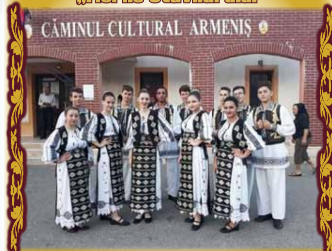
În fața sălii de spectacol din comuna Armeniș, Jud. Caraș-Severin, unde au încântat publicul spectator