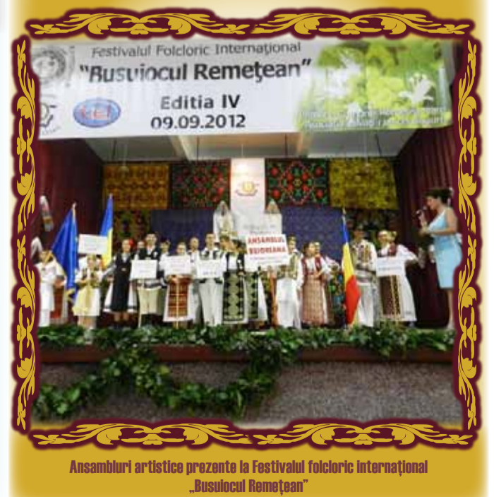
Ansambluri artistice prezente la Festivalul folcloric internațional „Busulocul Remetean”