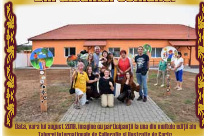
Bata, vara lui august 2019, imagine cu participanții la una din multele ediții ale Taberei Internaționale de Caligrafie și Ilustrație de Carte