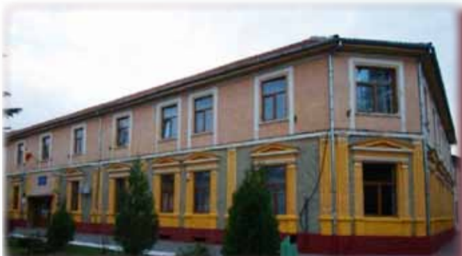
Liceul din Deta