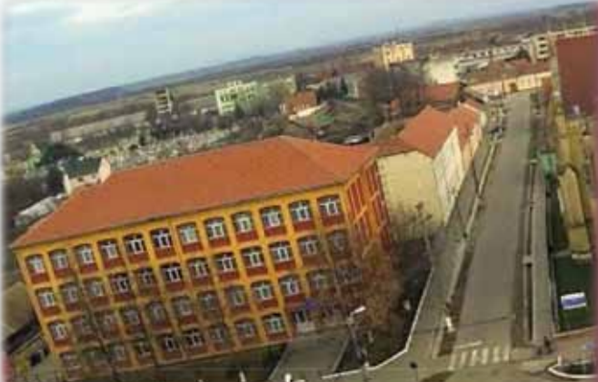
Școala gimnazială și grădinița din Deta

În anul 2004 s-au aniversat 80 de ani de la întemeierea Liceului din Deta. Decretul regelui Ferdinand I a fost semnat la 6 decembrie 1924, de Sfântul Nicolae. În memoria acestei date, conducerea școlii a propus și autoritățile au aprobat ca denumirea unității de învățământ din Deta să fie Grupul Școlar „Sfântu Nicolae” Deta, denumire care s-a păstrat până la începutul anului școlar 2013-2014, când școala din Deta a primit denumirea de Liceul Tehnologic „Sfântu Nicolae” Deta.