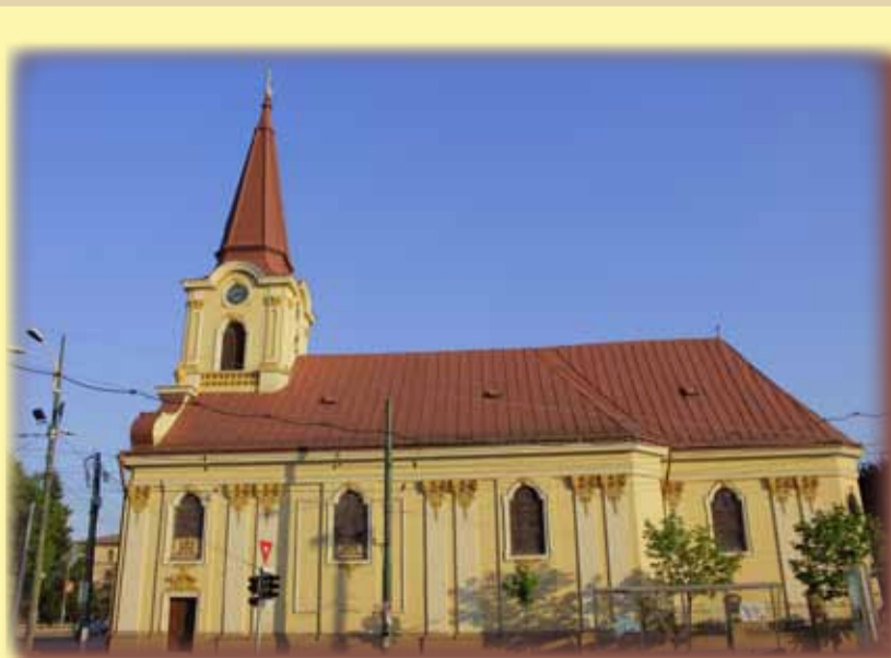
Biserica parohială romano-catolică

A cum 236 de ani, în centrul unui Atârnăr cartier timișorean - Iosefin - ce tocmai își primise numele după împăratul omonim, se ridică un lăcaș cu rol de biserică parohială a cartierului. Astăzi, biserica este unul dintre cele mai vechi edificii religioase ale orașului. Ea este un obiectiv turistic important ce aduce cu sine parfumul unei epoci apuse. În anul 1774, comunitatea catolică din Iosefin, sprijinită de episcopia romano-catolică și de oraș, își construiește acest lăcaș în stil baroc, caracteristic vremii. Clădirea a fost restaurată în mai multe rânduri, semn că vremurile nu iartă. Un privitor atent observă cel puțin două „ciudățenii”. Turnul este mult mai înalt și ascuțit decât turnurile altor biserici în stil baroc, în anul 1849, cu prilejul bombardamentelor, turnul a fost parțial