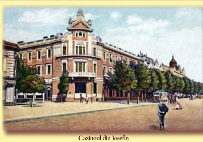
Cazinoul din Iosefin