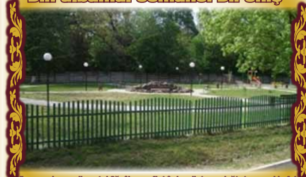
Frumosul parc din satul Căpâlnaș, aflat în imediata vecinătate a unui la fel de frumos teren de sport, ambele dotate cu instalație de iluminat modernă.