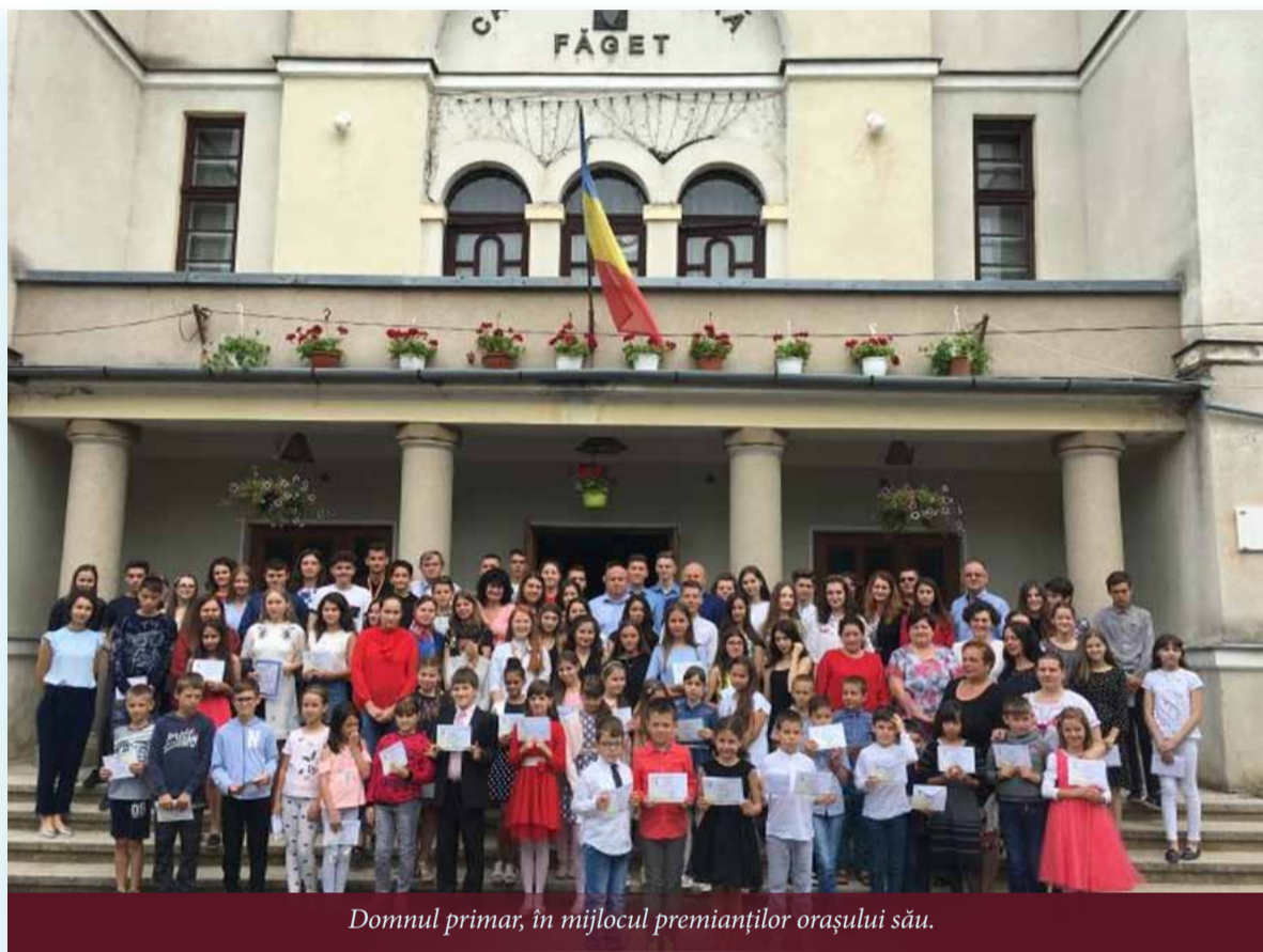
Domnul primar, în mijlocul premianților orașului său.