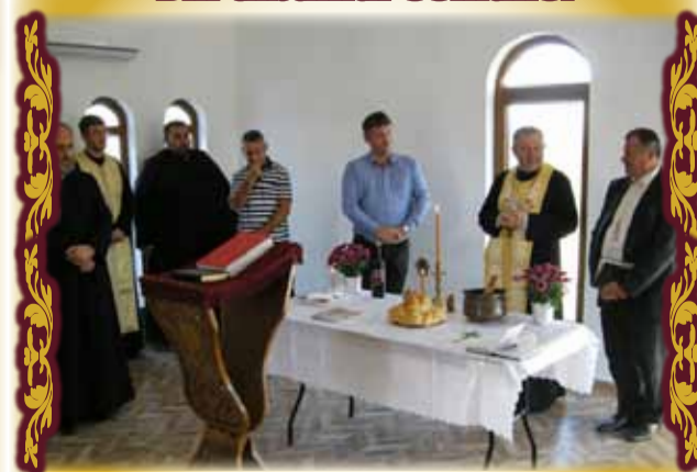
Sfințirea Capelei din Topolovățu Mare