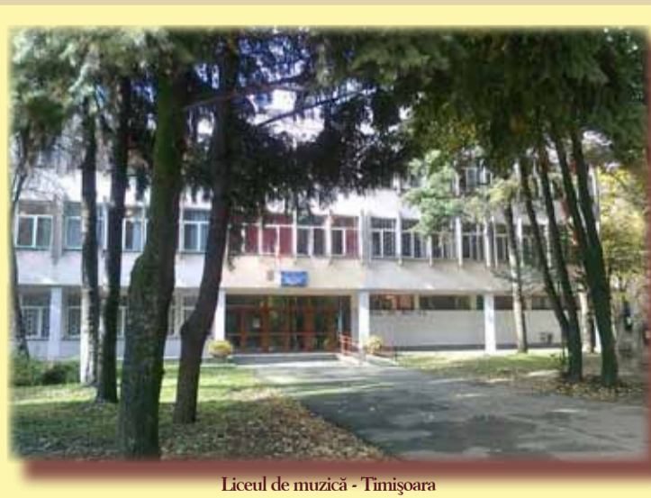
Liceul de muzică - Timișoara