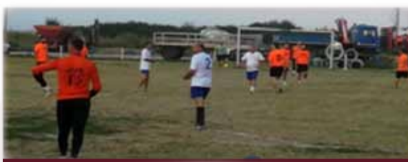
Marea Finală, Opațița I - Vulturii Mehala

petiția cu tradiție de ani și ani de zile a beneficiat de participarea a șase echipe cunoscute în zona noastră: Vulturii Mehala, Deta Juniori, ANL Deta (Grupa A), Opațița I, Opațița II, respectiv Radu și Fildan (Grupa B). Meciul pentru obținerea locului III și IV a fost jucat între ANL Deta și Radu și Fildan, iar Marea Finală, între Vulturii Mehala și Opațița I. Câștigătorii campionatului au fost jucătorii echipei Opațița I, pe Locul II situându-se Vulturii Mehala, iar pe Locul III, echipa Radu