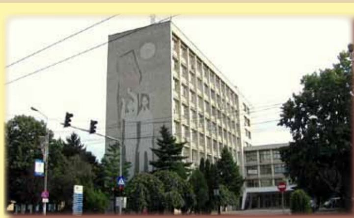
Universitatea de Vest din Timișoara

Decretul regal nr. 660 din 30 decembrie 1944 hotărăște înființarea, la Timișoara, a Universității de Vest, cu șapte facultăți. Cum însă vremurile tulburi continuă după război, visul bănățenilor mai are de așteptat. Se înființează doar două facultăți (azi universități independente), în 18 iulie 1945, Facultatea de Medicină și pe 30 iulie 1945, Facultatea de Agronomie. Prin decretul 177/308.1940 se înființează un Institut Pedagogic de trei ani pentru matematică-fizică. Din 1957 apare și filologia, cu cinci specializări. Prin H.C.M. nr. 999/27.09.1962, fostul institut se transformă în universitate cu două facultăți. Din 1967 se înființează și Facultatea de Științe Economice. Prin asimilare, au trecut la Universitate și facultățile defunctului institut. Specializările au fost de cinci și trei ani, până în 1977, când cele „mici” (de trei ani) au fost desființate. Abia după