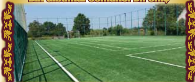
Noul și modernul teren de sport cu gazon sintetic din satul reședință de comună

PAGINA COORDONATĂ DE PROF. ROXANA FURDEAN