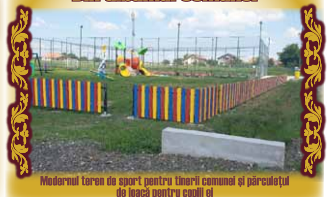
Modernul teren de sport pentru tinerii comunei și parcul de joacă pentru copii ei