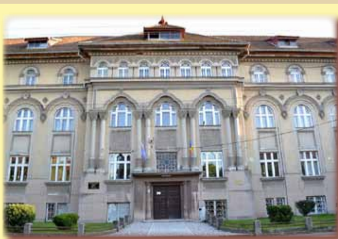
Institutul de Igienă - Timișoara

În anul 1945, o dată cu întoarcerea facultății la Cluj, aici se mută Laboratorul de Igienă de alături. Prin Decretul nr. 644/16.08.1946