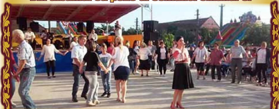
Această poză le va aminti celor ce se regăsesc în ea, de „Balul Tinereții” de la Carani. „Ce ropede trec anii”, vor spune unii. Trec...