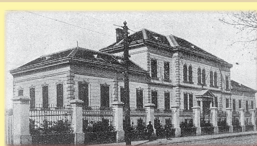
Institutul pentru Orbi