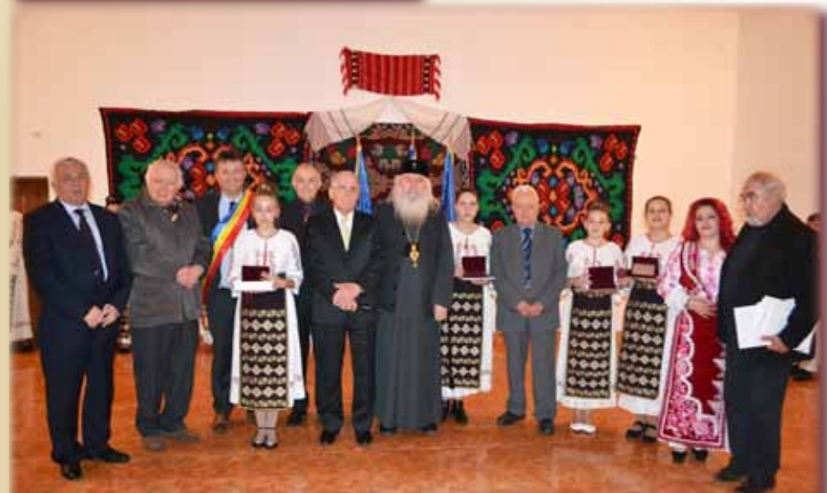
Laureații alături de conducerea Uniunii