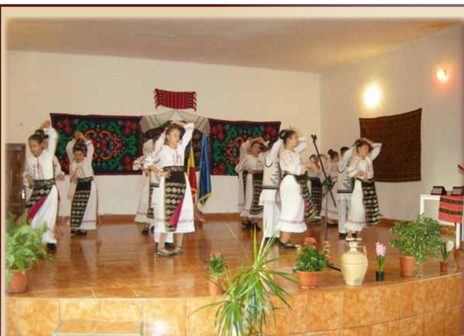
În Banat potop să cadă / Tăt se cântă și se joacă