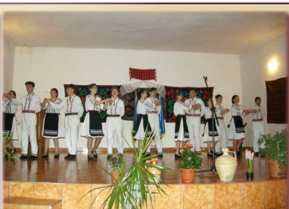
Joc din Țara Banatului