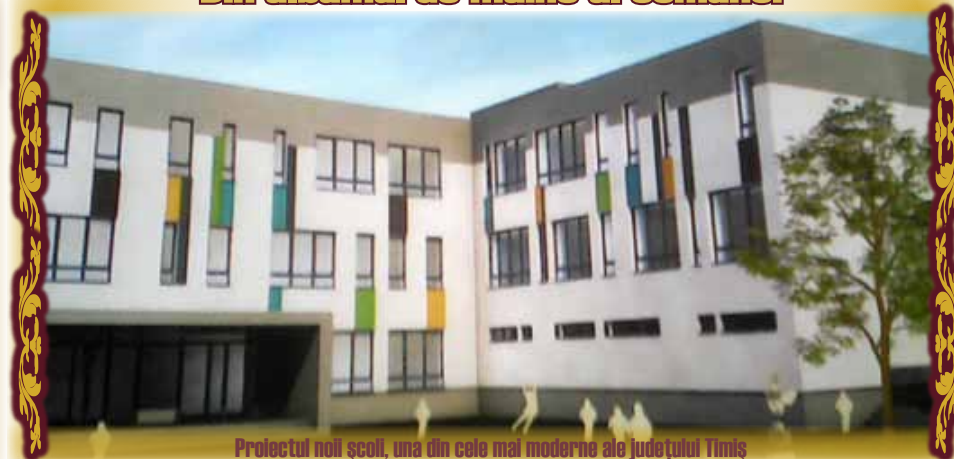
Proiectul noii școli, una din cele mai moderne ale județului Timiș