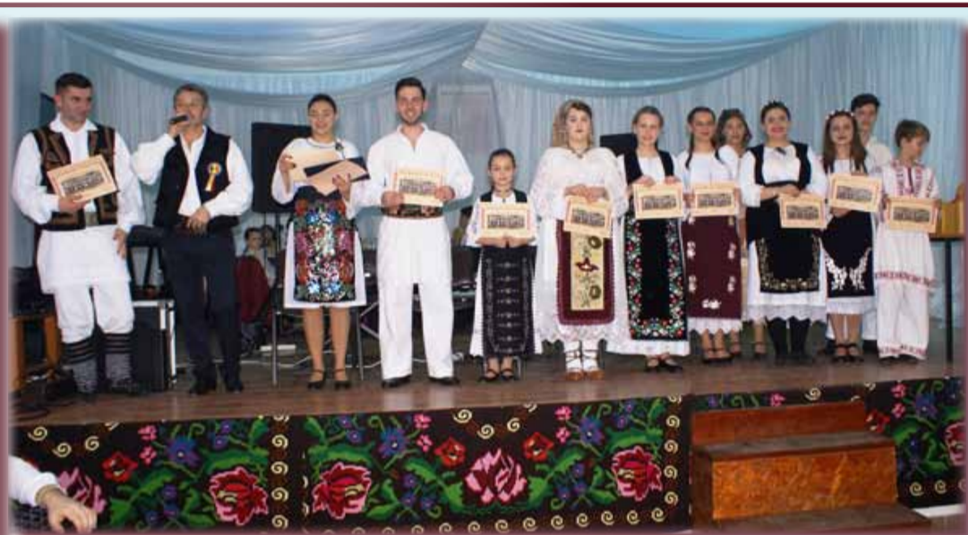
VERMEȘ – CAPITALA PORTULUI BĂNĂȚEAN