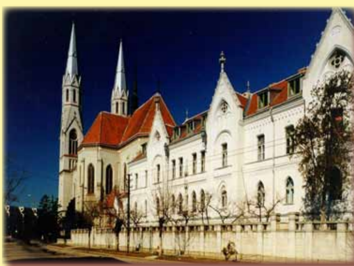
Biserica romano-catolică din Elisabetin - Piața Lahovary

În anul 1899 se constituie în Elisabetin o asociație pentru construcția unei biserici catolice. Oamenii încep să adune banii; la restaurantul „La trei coroane” se organizează anual o manifestare ale cărei fonduri revin asociației. Episcopul Dessewffy lasă și el 50.000 de coroane aceluiași scop. În anul 1902, primăria cumpără terenul de la Georg Buresch cu 17.000 de coroane și-l donează cartierului. Mai mult celebrul primar Telbisz donează și 60.000 de cărămizi rezultate din demolarea vechii biserici piariste și 80.000 de coroane. Planurile complexului sunt făcute de celebrul arhitect budapestan Karol Salkovits și costă 225.000 de coroane. Constructori sunt desemnați Albert Schmidt și Johan Bagjanszky. Pe 12 iunie 1912 încep lucrările de construcție. Ele înaintază ușor până când la turnul de sud apare apa. Ca urmare este nevoie de o fundație mai adâncă cu 3 metri decât la tur-