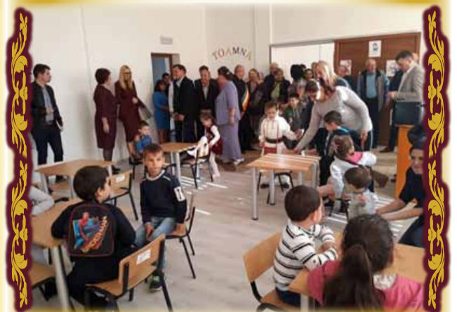
Drumul spre școlile înalte se deschide aici...