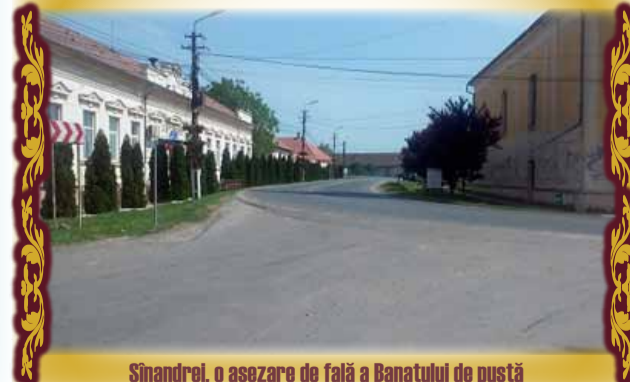
Sînandrei, o așezare de fală a Banatului de pustă