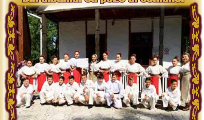
Ansambul Primăriei comunei Remetea Mare răsplătit, la Timișoara, cu Diploma de Onoare pentru „conservarea și promovarea valorilor culturii tradiționale bănățene”