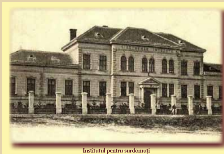
Institutul pentru surdomuți

Karl Schäffer a urmat cursurile speciale la Viena și, o dată întors acasă, deschide în 1885 prima școală privată destinată celor din lumea tăcerii. Ea funcționa în școală comunală din Iosefin. La inițiativa lui Heinrich Baader, orașul alocă sume importante pentru construcția actualului local. O premieră în România, căci doar la București mai exista o mică secție pentru surdomuți, nu o școală întreagă. Arhitectul și antreprenorul Leopold Löffler ridică clădirea între anii 1894 și 1897; fonduri vin din moștenirea episcopului Al. Bonnaz și de la Primărie. Pe 2 octombrie 1897 începe primul an școlar care se derulează aici. În 1900-1901, clădirea cu un etaj este supraetajată, căci nevoile școlii au crescut. La Londra, în