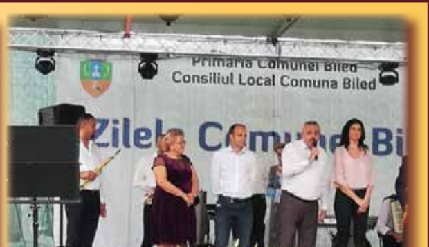
Conducerea județului Timiș, pe scena sărbătorii