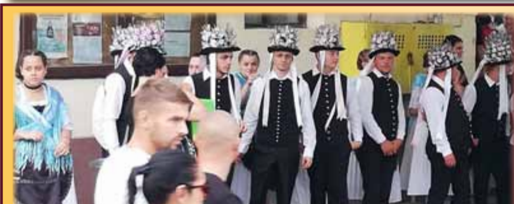
Portul german mereu prezent la Biled