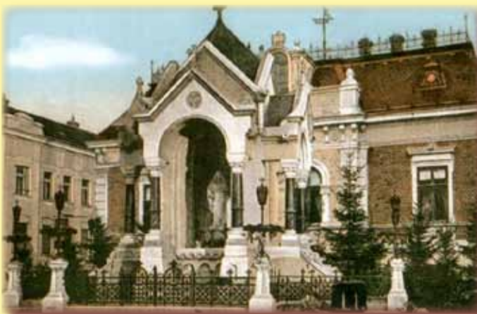
Monumentul „Sfânta Maria” din Piața Maria