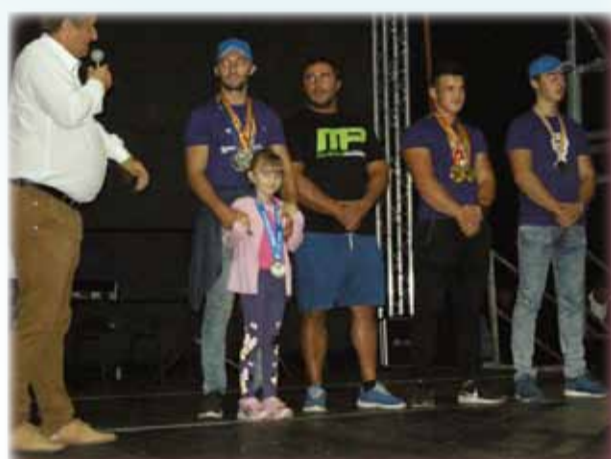
Felicitări la scenă deschisă Echipei de skanderberg de la Ictar-Budintși

A urmat apoi, în deschiderea spectacolului,