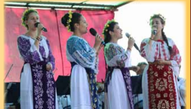
„Flori artistice” ale Birchisului