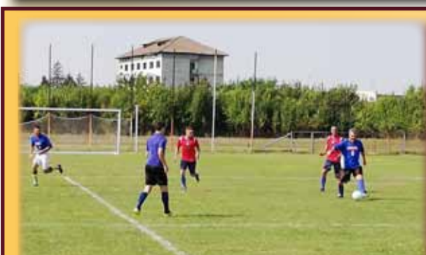
Fotbaliștii Biledului, în pas de... gol