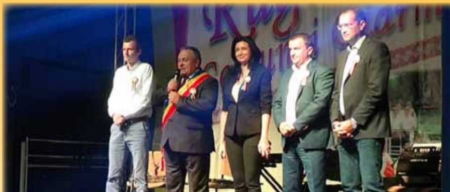
Domnul primar, având în dreapta imaginii, conducerea județului Timiș