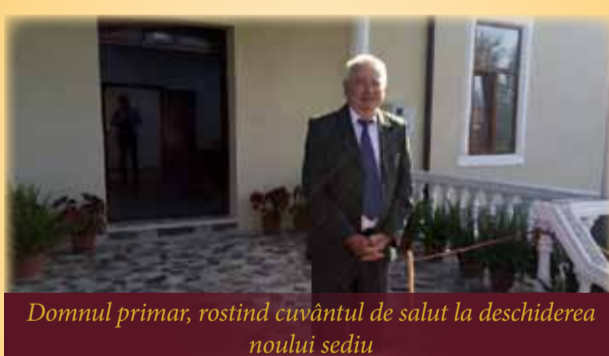
Domnul primar, rostind cuvântul de salut la deschiderea noului sediu