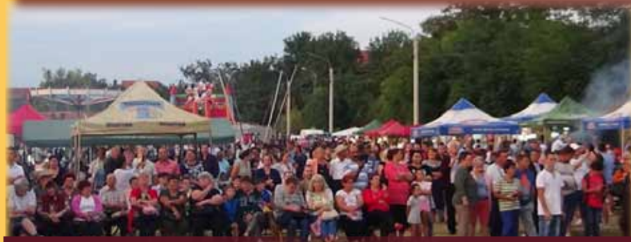
În fața scenei, un numeros public