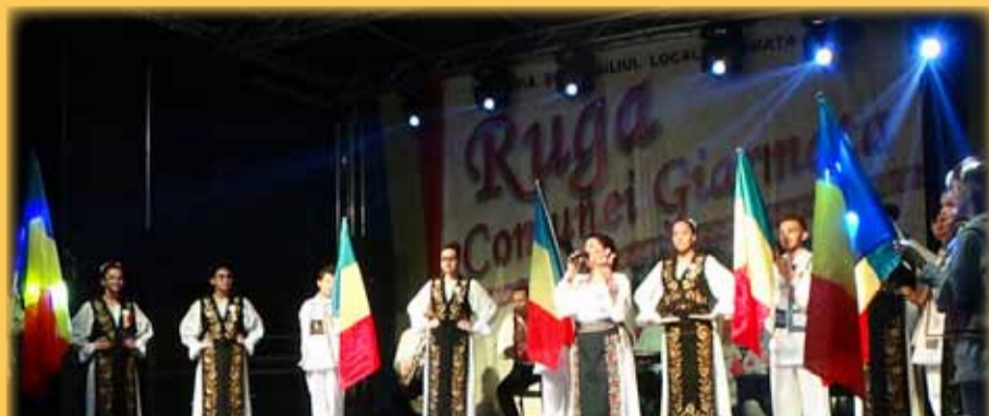
Drapelul tricolor este icoana României † Ioan, Mitropolit al Banatului istoric

„Sper ca ei să înțeleagă că această comună are nevoie de oameni întreprinzători, harnici, corecți și dedicați în tot ceea ce fac spre folosul și binele localității. Am avut alături de mine pe scenă un viceprimar tânăr cu ambiții mari, dar și consilieri la fel de tineri atât din opoziție, cât și de la putere, fiindcă în politică trebuie să fii deschis, iar alternanța la putere înseamnă că trebuie să dai cuvântul tuturor, indiferent de ce parte sunt. Tinerii aceștia sunt modești, dar inteligenți, manageri buni, foarte harnici și dedicați interesului comunei. Pe viitor oamenii trebuie să conteze pe ei, fiindcă merită. Este clar că localitatea este și va fi pe mâini bune”, a mai spus domnul Bunescu.