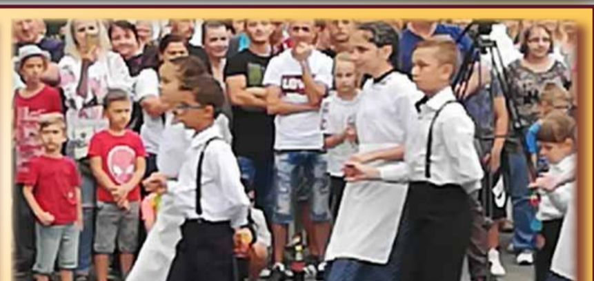
În pas de dans, viitorii artiști ai comunei