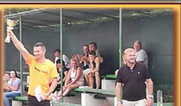
Cupa, înmănată de domnul primar, e prezentată spectatorilor