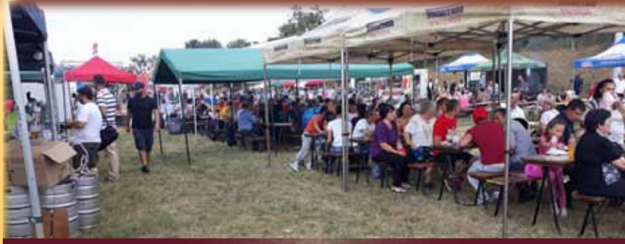
Gazde și goști, cinstindu-se la ceas de sărbătoare