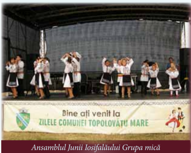
Ansamblul Junii Iosifalăului Grupa mică

Există sărbători în Banatul nostru care prin frumusețea, durata și veselia oamenilor îmi amintesc mereu, privindu-le, de „Nunta Zamfirei”. O astfel de sărbătoare, ce s-a desfășurat pe durata a două zile, s-a petrecut în comuna Topolovățu Mare. Nume importante de artiști, tineri ai comunei aparținând unui frumos ansamblu local, invitați de onoare, au urcat, rând pe rând, pe scenă.