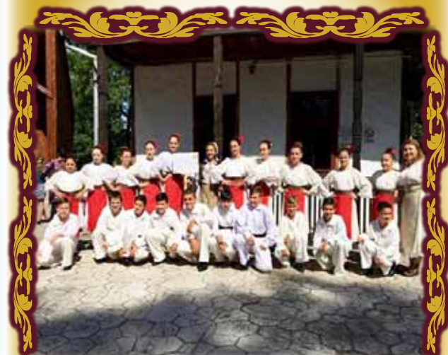
Jocul popular remețean se află pe mâini bune!