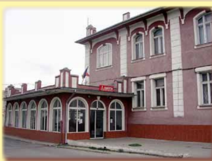
Banatul - cea mai modernă fabrică de încălțăminte din Europa (acum 118 ani)

Povestea începe, cândva, în anul 1900. Atunci un anume Alfred Fränkel din Mödlingen își lichidează afacerile acolo și poposește în Timișoara. Auzise omul că aici Primăria oferă facilități extraordinare oricărui investitor serios. Omul aducea un capital de 2.000.000 de coroane și se obliga să angajeze câteva sute de muncitori, iar condițiile de lucru din fabrică să fie cele mai modeme. În februarie 1901 încep lucrările de construcție ale complexului industrial. Doar hala principală măsoară 1.600 mp. Primăria a dat gratuit terenul și câte 50 de coroane pentru fiecare muncitor angajat. Și Fränkel angajase 750. Fabrica avea hale auxiliare, depozite de materiale, sală de mese pentru angajați, grădiniță pentru copiii acestora, clădire administrativă, flori și multe altele. Era o plăcere să te plimbi pe acolo. Chiar și azi se