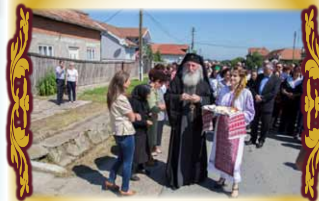
Înaltpreasfințitul Ioan, Mitropolit al Banatului Istorice, în vizită la noi.