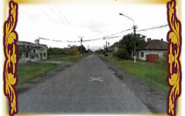
Amenajare stradală în comuna Remetea Mare