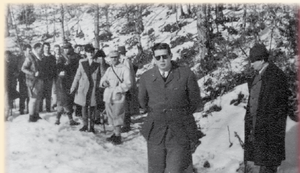
Regele Mihai, la vânătoare în zona Bulciului

► Azi suma ar fi considerabil mai mare. Dar, de atunci, am tot primit oferte din partea unor oameni interesați să cumpere acest obiectiv. Pentru noi, oameni ai locului, ar fi fost o mare bucurie ca acest castel să fie reabilitat iar destinația care i se va da, oricare va fi, nu poate decât să fie benefică pentru comunitatea noastră. Chiar am venit în sprijinul unor astfel de potențiali investitori, prin asfaltarea drumului de la Țela până la Bulci.