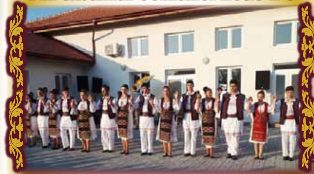
Tinerii Vermeșului în zi de sărbătoare