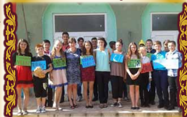
Elevi ai Școlii Gimnaziale „Alexandru Mocioni” din Birchis