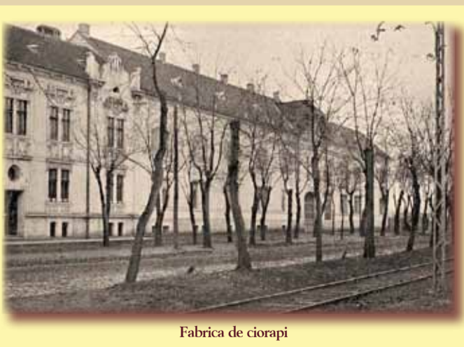
Fabrica de ciorapi

La încrucișarea străzii Telegrafului și lângă depozitul lui Blau, adică, pe înțelesul nostru, la încrucișarea străzii Telegrafului cu strada Mihail Kogălniceanu, se ridică în anul 1906 clădirile uneia din marile fabrici ale începutului de veac: prima fabrică de țesut și tricatat din Gyula S.A., azi, Fabrica de Ciorapi din Timișoara, după lungi discuții, membrii societății pe acțiuni s-au angajat să investească în clădiri și mașini 314.000 de coroane și un capital de 250.000 de coroane. Avantajele oferite de Primărie constau în: scutire de taxe pe 15 ani, donarea unui teren de 2.334 de stânjani pătrați, cărămidă pentru fundație și câte zece coroane de fiecare muncitor angajat pe an, dar suma să nu depășească 4.000 de coroane anual. Astea da avantaje pentru