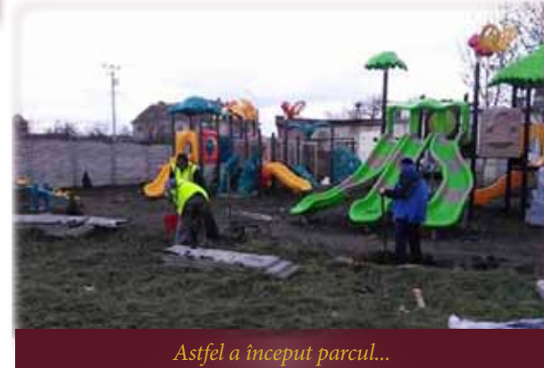
Astfel a început parcul...

Până la ora fixată pentru festivitatea de deschidere, admir această locație dedicată pruncuților din comună. Totul este nou, fiecare modul este bine gândit, felicitări Consiliului Local și Primăriei comunei Remetea Mare.