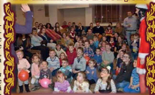
Moș Crăciun și prietenii săi, împărțind daruri pentru copiii salariaților Aquatim.