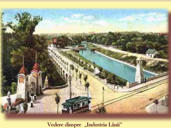
Vedere dinspre „Industria Lânii”

Un nume de tradiție care a intrat de mult în fizionomia orașului este Industria Lânii. Un consorțiu anunță Primăria, în iulie 1905, că vrea să construiască o filatură camgran cu 2.000 de fusuri și că va investi suma de 460.000 de coroane, iar valoarea acțiunilor se va cifra la 600.000 de coroane. Consorțiul precizează că va angaja și 100 de muncitori. Primăria, având solide garanții bancare din partea consorțiului, îl scutește pe 15 ani de taxe municipale, inclusiv taxele pentru construcție, și donează fabricii 2,5 jugăre cadastrale de teren, îi vinde, pentru 50.000 de coroane, instalația de produs curent electric a tramvaielor, tocmai înlocuită acolo. La o asemenea dărnicie, investitorii anunță că vor mai înființa aici o vopsitorie; un atelier de dărăcit, o broderie și o țesătorie. În martie 1906, fabrica și-a început producția. Cum însă numărul fusurilor s-a mărit până la 13.000, firma cumpără încă 1.057