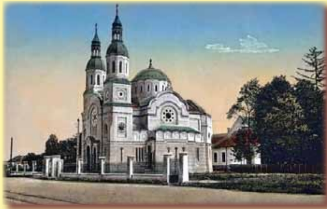
Biserica Ortodoxă Română din Fabric

Pe locul podului Decebal de astăzi, ce duce din Fabric spre drumul Lugojului, era pe vremea când Bega curgea pe str. A. Șaguna - o biserică. Ea era urmașa unei alte biserici medievale, din cartierul Palanca Mare. În anul 1826 se ridică acea biserică. Până în anul 1909, ea slujește scopurilor ortodoxiei. Atunci însă apar câteva situații noi: se regularizează cursul Begăi (dispărând canalele adiacente) și noul curs trece chiar prin biserică, se preconizează sistematizarea zonei și construcția unui pod. Ca urmare, se ajunge la o înțelegere între Primărie și parohie și, la 30 iunie 1909, se decide: Primăria ia în proprietate biserica și terenul, demolează clădirea pe cheltuiala sa și dă la schimb un lot de teren de 456,4 stânjeni pătrați parohiei; și tot Primăria (cu acordul parohiei) zidește o biserică ortodoxă până la suma