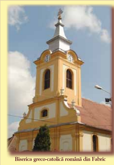
Biserica greco-catolică română din Fabric

Începuturile bisericii greco-catolice la Timișoara datează din anul 1737, atunci când se înființează aici prima parohie. În anul 1770, uniții (așa sunt ei cunoscuți) își zidesc o bisericuță lângă fosta insulă a popii, la intersecția de azi a Pieței A. Vlaicu cu str. Ștefan cel Mare. Patronajul bisericii l-a avut statul, până la 1782, apoi trece asupra primăriei orașului liber regesc Timișoara. O caracteristică a acesteia a fost exercitarea egală a patronajului asupra tuturor cultelor, fără discriminare. Parohia unită de aici avea și rol de vicariat, între 1777 și 1790, apoi din 1932 până în 1948; și mai apoi, după revoluție, la fel. Clădirea bisericii se șubrezește cu vremea, așa încât, în 1906, Primăria decide preluarea vechii biserici spre demolare și atribuirea fostei biserici romano-catolice din Fabric (între timp s-a construit una nouă în piața Romanilor) pe seama parohiei greco-catolice. Primăria mai sprijină repararea acesteia cu 14.000 coroane, la care parohia adaugă alte 1.000 coroane. În zilele de sâmbătă și duminică,