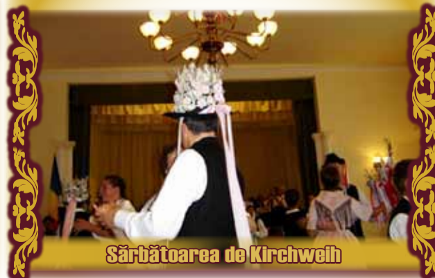
Sărbătoarea de Kirchweih