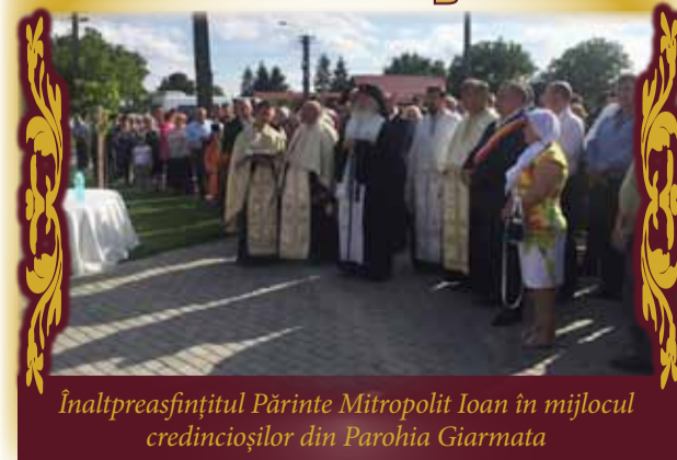
Înaltpreasfințitul Părinte Mitropolit Ioan în mijlocul credincioșilor din Parohia Giarmata