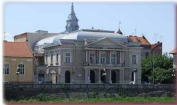
PENTRU OASPEȚII NOȘTRI - LUĞOJUL DE ALTĂDATĂ

Fiecare lojă va avea opt locuri. Două dintre loje vor fi amenajate în sala mare, la parter, în zona centrală, lângă cele două intrări, iar la balcon se vor compartimenta alte șase loje pe extremele laterale. Întreaga sală de spectacole va avea aproximativ 400 de locuri, 100 fiind la balcon.