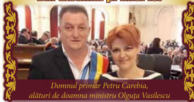
Domnul primar Petru Carebia, alături de doamna ministru Olga Vasilescu