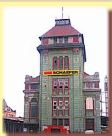
Fabrica de baterii "Dura"

Cine mai știe azi de celebrele baterii timișorene de odinioară? Doar cei ajunși la vârsta înțelepciunii și a cunoașterii. Cum Timișoara a fost primul oraș european cu străzile iluminate electric, era normal ca industria electrică și electrotehnică să se dezvolte de timpuriu. Ateliere și fabrici de corpuri de iluminat de forme și mărimi diverse s-au creat, au lucrat și au dispărut. Una dintre cele care au renăscut este și „Dura” SA de azi. Ea s-a înființat la 7 februarie 1930 și-și avea sediul pe Calea Buziașului, la nr. 15, în primii șase ani, apoi s-a mutat la sediul din str. Pestalozzi. Avea, la începuturi, 70 de lucrători, 30 HP putere instalată. „Dura” se naște din banii Băncii „Timișoara”, prin fuzionarea fabricilor „Dura” și „Lumina”. Prima datează din 1921, ca fabrică electrotehnică și tehnică, ce producea baterii, mașini electrice etc. Profitul a fost constant și obținut printr-o politică