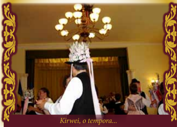
Kirwei, o tempora...