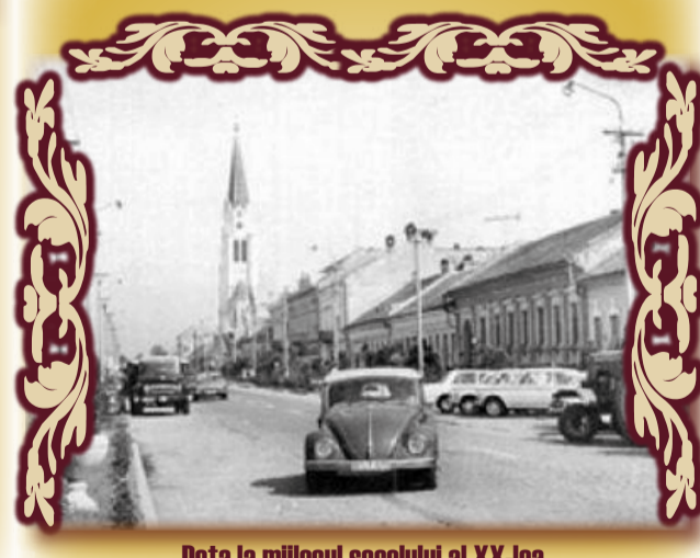
Deta la mijlocul secolului al XX-lea