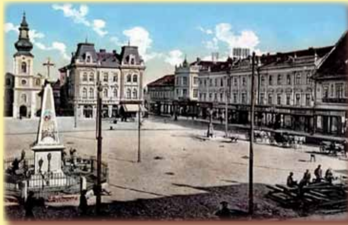
Un zeu și un obelisc din Piața Traian

Cândva una dintre cele mai frumoase piețe ale orașului, Piața Traian de azi trăiește din amintiri. Era aici o viață comercială înfloritoare; era o lume pestriță, grăbită în afaceri dar dornică de petreceri; în același timp îndreptată și spre cele sfinte. Din mărturiile pe care timpul sau oamenii nu au reușit să le distrugă azi sunt două: o clădire și un obelisc. Clădirea se numea pe vremuri „Mercur”. Azi este una anonimă, la parter cu o alimentară și alte câteva spații comerciale. La începuturile sale, totodată și ale veacului, clădirea avea un bun gust arhitectonic. De privești cărți poștale de atunci observi armonia construcției și frumusețea deosebită a fațadei. Doar două etaje, dar ce frumoase! Ea se întinde pe două străzi: piața și str. Dacilor. Ferestrele, simetric dispuse, sunt despărțite de coloane false, înspre