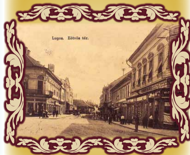
Lugojul în vremea „drăguțului de împărat”