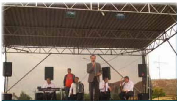
Primarul comunei noastre, salutând gazdele și goștii

participat la cea de-a doua ediție a concursului de biciclete „Pedalează pentru sănătate”, unde s-au întrecut în primul rând în grija pentru sănătate și un stil de viață armonios și pentru a convinge cât mai mulți tineri de beneficiile activităților fizice. După premierea acestor tineri, fanfara „Pro Amiciția” a făcut să răsunе străzile Ceneiului de strigătul pur al recunoștinței. Spre seară, întreaga comunitate s-a adunat să petreacă la bal, după cum istoria a înrădăcinat acest obicei în viețile noastre.