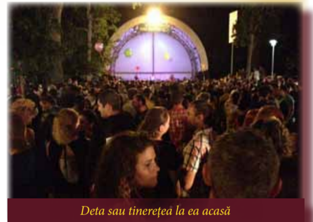
Deta sau tinerețea la ea acasă