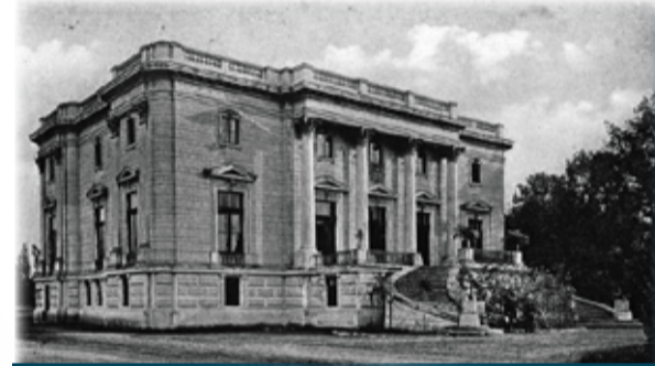
Micul Trianon al comunei noastre

în școală se înscriu printre cele mai moderne, punându-se accent pe relația dintre părinte, copil și învățător: Avem o colaborare foarte fructuoasă cu părinții elevilor noștri care vin mereu la ședințe și cu care discutăm și cele mai mici detalii. De asemenea, domnul primar ne ajută mereu și îi suntem recunoscători. Chiar în ultimii doi ani, prin eforturile cumulate ale noastre și ale domnului primar,