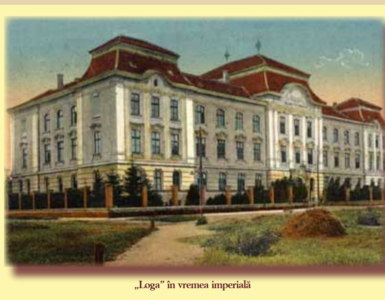
„Loga” în vremea imperială

Pentru zeci de mii de timișoreni, când rostești aceste cuvinte, spui totul: locul unde au învățat carte serioasă, locul unde au cunoscut dascăli excepționali, locul unde s-au format ca oameni. Absolvenții liceului au constituit chiar o asociație, semn că Liceul „Loga” este un nume în istoria orașului Timișoara. Pentru ei, dar și pentru dumneavoastră, ceilalți care nu ați urmat școala aici - o succintă prezentare. La 1 septembrie 1897 se deschid cursurile Liceului real de Stat, în Clădirea școlii din strada Telbisz. Tot atunci, Primăria donează un teren de 2.400 de stânjeni pătrați, pentru construcția noii școli. O asociație de sprijin adună bani, inclusiv un ajutor anual al primăriei și al ministerului. Planurile le face cunoscutul arhitect budapestan Ignaz Alpar. Costurile totale ajung la 400.000 de coroane. La 1 septembrie 1903 are loc deschiderea festivă a școlii. Construcția are elemente