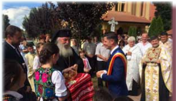
Domnul primar Florin Bucur îl întâmpină cu pâine și sare pe Președintele de Onoare al jurnalului nostru, Înaltpreașfinția Sa Ioan

„Este prima mea rugă, mă bucur mult că am reușit să ajung pe poziția de „primul om al comunei”, să spun așa, și mulțumesc cetățenilor pentru aceasta, pentru că au făcut această alegere. Cu siguranță, voi încerca să nu-i dezamăgesc. Am avut astăzi bucuria să avem printre noi pe Înalt Preașfinția Sa Mitropolitul Ioan, care ne-a făcut o mare bucurie. Pentru mine a fost o minune că a venit chiar în primul an de mandat, bineînțeles la invitația părintelui Gâță, cu care pot spune că am o colaborare foarte bună și îl stimez, apreciez și respect foarte mult, probabil că și de aceea, existând acest respect între noi, a și făcut acest pas de a-l invita pe Mitropolit în acest an la sărbătorirea Hramului. Ne-am ocupat împreună cu Administrația locală ca această rugă să iasă foarte bine, ne-am dedicat total acestui eveniment. Am adus formații de muzică bună, îl avem pe domnul Tinu Vereșezan, pe doamna Ianculovici, nume frumoase în muzica populară. Avem și a doua zi de rugă, ceea ce nu s-a mai făcut de mult la Moșnița, este o zi de rugă alfel, cum i-am spus noi. Avem teatru pentru copii, avem filarmonica, avem clovni pentru copii, avem un band de muzică live ușoară, avem DJ, avem MC (n.r. maestru de ceremonii). Este o rugă pe cinste! Am reușit să o facem cu un buget destul de mic, le mulțumesc tuturor celor implicați și îmi doresc din ce în ce mai multe evenimente culturale pe raza localității noastre, pentru că asta înseamnă promovarea localității Moșnița Nouă.”