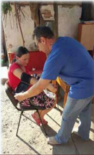
Asistenții medicali comunitari au asigurat controale medicale de rutină pentru cei care au dorit

Organizația de Cruce Roșie Lipova își continuă seria de acțiuni umanitare, educative și de ajutorare și în acest an, echipa care formează organizația lipovană punând deja în aplicare o parte din aceste acțiuni prevăzute pentru anul 2016. Astfel că, mai multe familii cu o situație mai precară au avut surpriza de a fi vizitați de reprezentanții Crucii Roșii și să primească diverse lucruri, care cu siguranță le vor fi de folos.