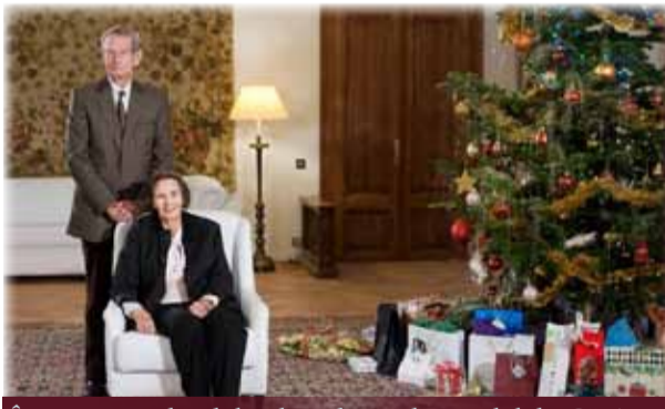
În apropierea bradului de sărbători la castelul din Săvârșin

Principesa Ana de Bourbon-Parma, soția regelui Mihai, a murit în 1 august, la vârsta de 92 de ani, la Spitalul din Morges, în Elveția. Localnicii din comuna Săvârșin, județul Arad, acolo unde se află reședința preferată a Familiei Regale, au primit cu tristețe vestea morții Reginei Ana, amintindu-și, emoționați, de prima ocazie cu care soția Regelui Mihai a mers în zonă, singură, prin anii '90, și a fost primită de o familie. „Comunitatea