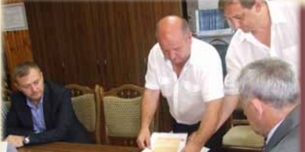
Ședința de constituire a Consiliului Local Biled - 22 iunie