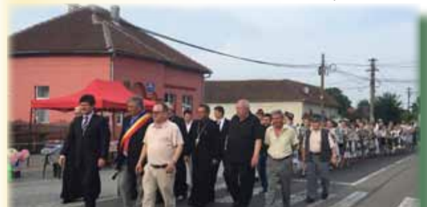
Domnul primar în fruntea goștilor

Începută cu ceremonia religioasă de la 17:30 de la Biserica Ortodoxă din Bata și oficiată de trei preoți, Ruța a continuat la locul special amenajat din incinta Căminului Cultural din Bata, locul care în fiecare an adăpostește festivitatea rugii satului, cu spectacolul de dans folcloric al Ansamblului Valea Mureșului, aflat