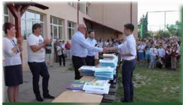
Domnul primar felicitând premianții

Emoțiile nu au lipsit de la această frumoasă