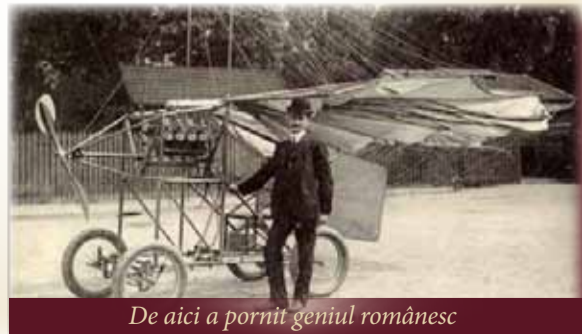
De aici a pornit genul românesc

Întreg sistemul și subsistemele sale sunt realizate integral în România, sunt produse 100% românești și nu putem fi decât mândri de asemenea reușite.