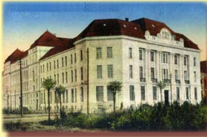
Timișoara imperială - Palatul Poștei

Este o clădire extrem de cunoscută tuturor, din diferite drumuri la sediul poștei din Timișoara. Pe locul ei exista, până la începutul secolului nostru, bastionul nr. 4 al cetății. După dărâmarea fortificației, primăria vinde terenurile nivelate celor doritori. Cei 1.205 de stânjani pătrați ai clădirii de azi au fost cumpărați, în anul 1905, de conducerea poștei, pentru 50 de coroane, stânjenul pătrat. Construcția începe ceva mai târziu. În lipsa oricăror documente (unde și când or fi dispăruți?), anul începerii construcției este când 1910, când 1911. Oricum ar fi fost, în 1913, palatul este terminat. Unii atribuie planurile clădirii arhitectului budapestan Ignaz Alpar, alții, timișorenilor Ladislau Szekely, Kiss și Gabor. Până la edificarea clădirii noi, poșta timișoreană, atestată din 1722, a fost adăpostită în diverse localuri, iar în 1859-1860 a adăstat în Palatul Dicasterial. Creșterea fantastică a serviciilor poștale, telefonice și telegrafice, la începutul secolului