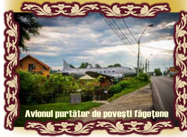
Avionul purtător de povești făgetene