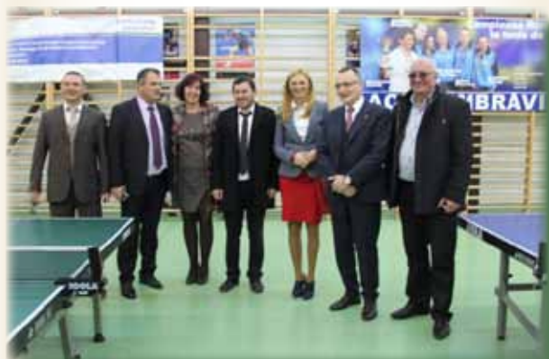
Ministrul Educației, Sorin Câmpeanu, alături de primarul comunei noastre