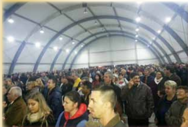
Localnicii în mijlocul evenimentului

La sfârșitul lunii octombrie localnicii din Sânaandrei au avut parte de o sărbătoare