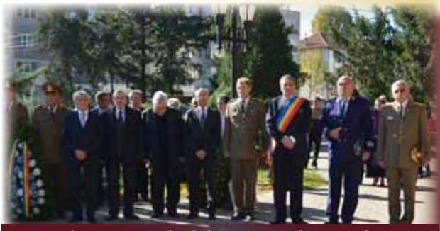
Domnul primar Marcel Vela la ceremonia depunerii de coroane