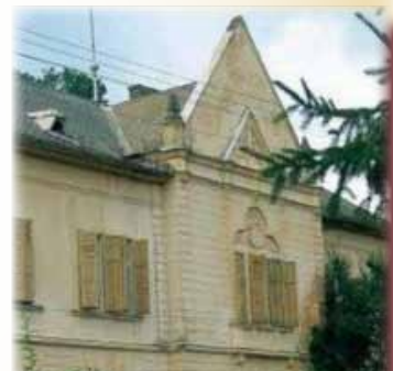
Castelul Mocioni emblema turismului bătan

Asta ținând cont și de aspectul că Bata este o zonă cu un peisaj deosebit. Peisaj promovată prin materiale promoționale precum: pliante, broșuri și CD-uri. Acestea cuprind în principal informații despre istoria locală a întregii comune, monumentele ce se pot vizita precum Castelul Mocioni de la Bulci, monumentele funerare a unor personalități istorice locale (cunoscute și la nivel internațional) dar și Biserica Ortodoxă de la Bata ori... Hanul Vânătorilor.