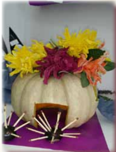
Căsuța pentru arici realizată de copiii de la grădinița din Ianova

Nici Halloween-ul nu a trecut fără a fi băgat în seamă. Pentru că personajele înfricoșătoare și scenele de film de groază i se par a fi prea mult pentru preșcolari, doamna educatoare a ales să-l serbeze în alt mod: „Am sărbătorit și Halloween-ul, dar în alt fel, în loc de monștrii din dovleac, noi am realizat o frumoasă căsuță pentru arici, arici care au fost făcuți la rândul lor din castane. Acest mod mi se pare mult mai potrivit pentru vârsta copiilor pe care îi am la clasă.”