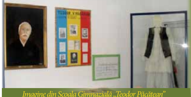
Imagine din Școala Gimnazială «Teodor Păcătean»

Cât privește școlile, acestea au cunoscut modernizări evidente: geamuri termopan, termoizolații exterioare ș.a. „La Școala Gimnazială «Teodor Păcătean» Ususău am construit și un nou corp de clădire cu dotări moderne, dat în folosință; finalizarea exterioară e în curs. La noi e foarte important confortul termic al copiilor. Astfel, aprovizionarea cu lemne pentru iarnă se face în avans; acum ne-am aprovizionat cu lemne pe anul viitor, cele pentru iarna asta sunt crăpate și puse la adăpost”.