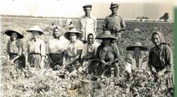
Holda, altarul bunăstării bănățene

snopii la batoză, alții erau pe batoză și dezlegau snopii și îi băgau în batoză, iar alții stăteau jos cu saci care erau umpluți cu grâu într-o parte și pleavă în altă parte. Sacii erau cărați în pod, pod care era întărit cu stâlpi de susținere pentru a nu se prăbuși sub greutatea sacilor.