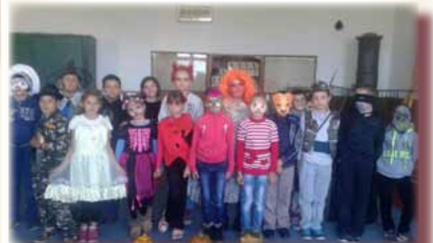
Elevii claselor a II-a și a III-a la „Carnavalul Toamnei”

Activitatea s-a încheiat cu un banchet, unde cei mici au avut parte de tot felul de gustări pregătite cu drag de părinții lor. Nu au lipsit prăjiturile și dansul.