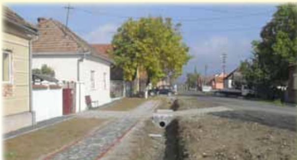
Faptele vorbesc de la sine - Străzile din comuna modernizate

De aici s-a pornit. Acum urmează să vedem unde s-a ajuns. Să începem cu infrastructura. „Proiectul Modernizare străzi în comuna Ususău – prin PNDR, pe durata de 3 ani – e în plină derulare. Este vorba de toate străzile – adică 6,3 km și peste 12,5 km de șanțuri pluviale betonate. Asfaltăm acum, în prima etapă,