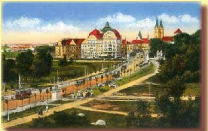
Timișoara în anul 1915 - Bulevardul Revoluției pe care, azi, se află hotelul Continental

Fără nicio intenție de a face reclamă, trebuie totuși să vorbesc câte ceva despre unul dintre simbolurile turistice ale Timișoarei: Hotel Continental. Arhitectul Gheorghe Gârleanu a imaginat - pe locul fostei cazărmi a Transilvaniei - un complex turistic deosebit ca ținută. Constructorii s-au străduit să transpună în operă gândul arhitectului: faptul s-a întâmplat în anul 1971. De 44 de ani, complexul Continental străjuiește zilele și nopțile turiștilor și chiar ale noastre, ale timișorenilor. Clădirea cu subsoluri, 13 etaje, terasă deasupra, terase laterale, magazine, săli etc. este - prin cele întâmplate în saloanele și camerele sale, parte a istoriei ultimelor trei decenii. În primul rând, turiștii ce au locuit aici au găsit și găsesc standardul și ștaiful - elemente definitorii și mândria personalului de aici. Un șir întreg de servicii de