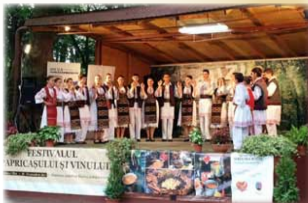
Ansamblul Vermeșana la Festivalul „Papricașului și al Vinului”

Aceste festivaluri ale toamnei au fost organizate în zone diferite ale Banatului: la Buziaș - Festivalul Papricașului și al Vinului - ediția VII-a (10-11 oct) și la Caransebeș - Festivalul