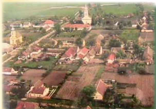
Checea - vedere de ansamblu