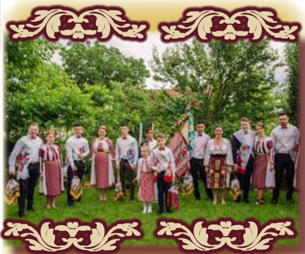
Imagine de nuntă din Ianova