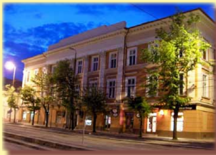
Palatul Deschan/Casa Scherter/Bazarul

În anul 1802, familia mărește și renovează clădirea, amenajând-o în stil neoclasic. Clădirea are parter și două etaje. Corpul din spate, cu un etaj, este mai vechi, fațada - mai nouă. Fațada are cinci travei încadrate cu coloane canelate, de factură corintică.