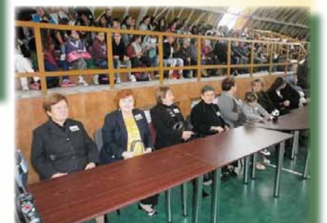
Cetățeni ai căror membrii de familie au luptat în cel de-al Doilea Război Mondial

Recaș, 9 octombrie 2015, la șapte decenii de la încheierea celui de-Al Doilea Război Mondial.