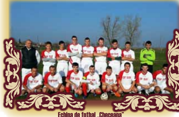
Echipa de fotbal „Checeana”