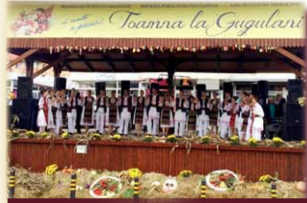
Ansamblul Vermeșana la Festivalul „Toamna la Gugulani”