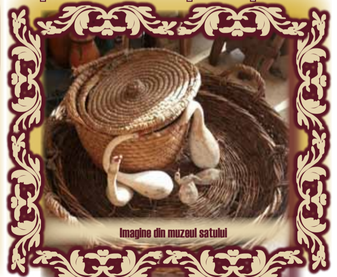
Imagine din muzeul satului