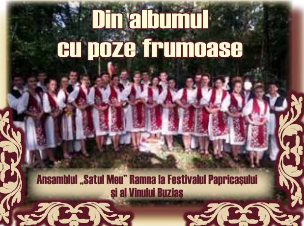
Ansamblul „Satul Meu” Ramna la Festivalul Papricașului și al Vinului Buzias