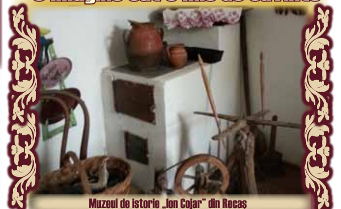
Muzeul de istorie „Ion Cojar” din Recaș