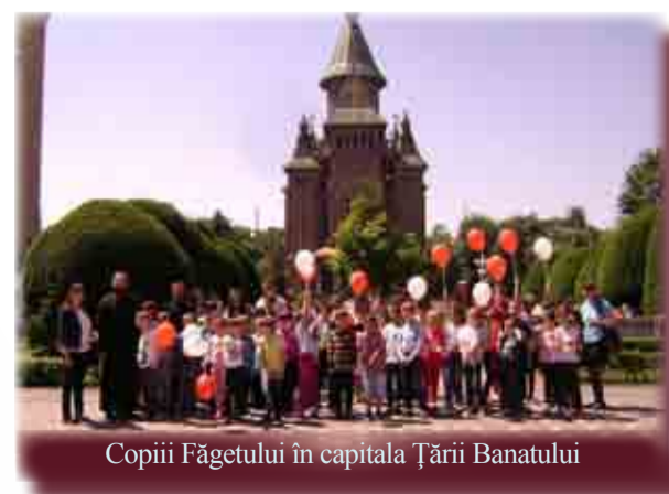
Copiii Făgetului în capitala Țării Banatului

sa de la Parohia Bichigi, la ea luând parte și tinerii acestei frumoase comunități. Între cele două grupuri s-au legat prietenii și nădăjdum speranțe pentru noi colaborări. Și beneficiarii Centrului