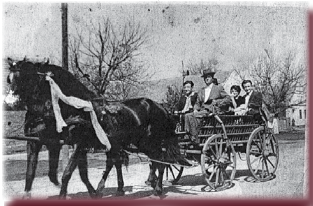
Căruță împănată, cu giverii pentru strigarea la nuntă

În ziua nunții, giverii cu alaiul de nuntă și cu muzica mergeau după nași, apoi împreună cu nașii după mire și mai apoi cu toții după mireasă. Când au ajuns în casa miresei, nașii cu mirele au întrebat dacă gazdele au o fată de măritat, la care aceștia au răspuns că da și în același timp au adus