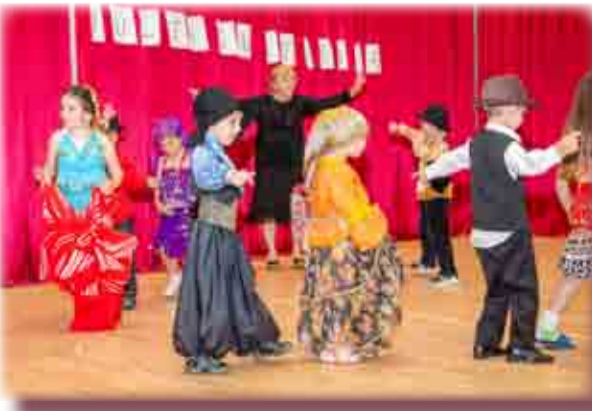
Serbarea a avut drept scop principal valorifi-