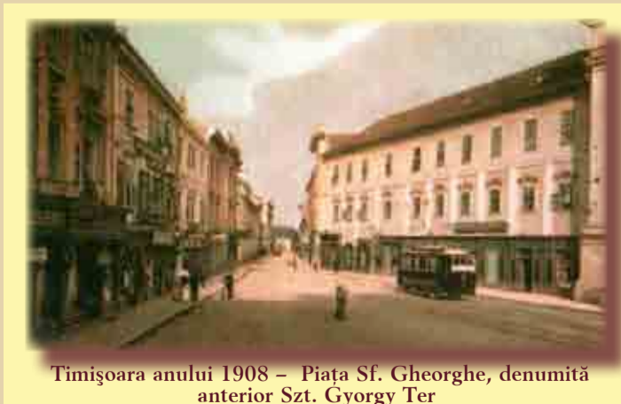
Timișoara anului 1908 – Piața Sf. Gheorghe, denumită anterior Szt. Gyorgy Ter

Piața Sfântul Gheorghe este dominată de două mari clădiri. Una este „Beba Veche”, așa cum îi spun toți timișorenii, alta este clădirea pe care generațiile actuale o cunosc drept „GICLT” sau, mai nou, Bancorex. Cea din urmă are o istorie interesantă și frumoasă. În anul 1845 se înființează la Timișoara „Prima casă de păstrare/economii din Timișoara” („Erste temeswarische Sparkasse”). Succesul depunerilor de către populație aduce prosperitate acestei adevărate bănci. Drept urmare, peste 10 ani, în 1885, firma își propune construirea unui palat care să adăpostească oficiile firmei, dar și alte utilități publice, ba chiar și apartamente de închiriat. Zis și făcut. Bani fiind suficienți, orașul având ingineri constructori și arhitecți pricepuți, planurile lor arată un edificiu impozant, cu trei etaje, de formă pătrată, cu frontoane pe patru străzi. În intenție era și construcția unui hotel, într-o parte a clădirii. Cum