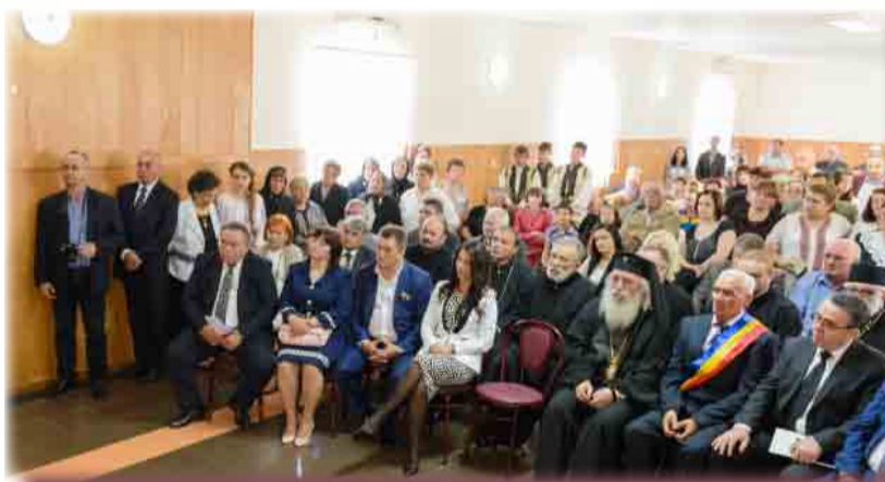
Doamna primar a comunei noastre alături de personalități prezente la eveniment

Domnișoară, se împlinesc în această vară, 299 de ani de când Prințul catolic Eugeniu de Savoia, marele comandant al armatelor austriece și admirator al lui Leibniz, a eliberat Timișoara; după exact un an, undeva la marginea pusteii bănățene se puneau piatra de temelie a comunei în care ne aflăm. Peste încă un an, Banatul devine, în urma păcii de la Passarowitz, Țară de Coroană , provincie a Imperiului Austriac, aflată sub coordonarea directă a Curții de la Viena. Urmas pentru Țara Banatului, 200 de ani de administrație