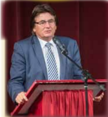
Primarul municipiului nostru rostind cuvântul de mulțumire, ca laureat la Gala Premiilor Uniunii Jurnaliștilor - Arad 2015