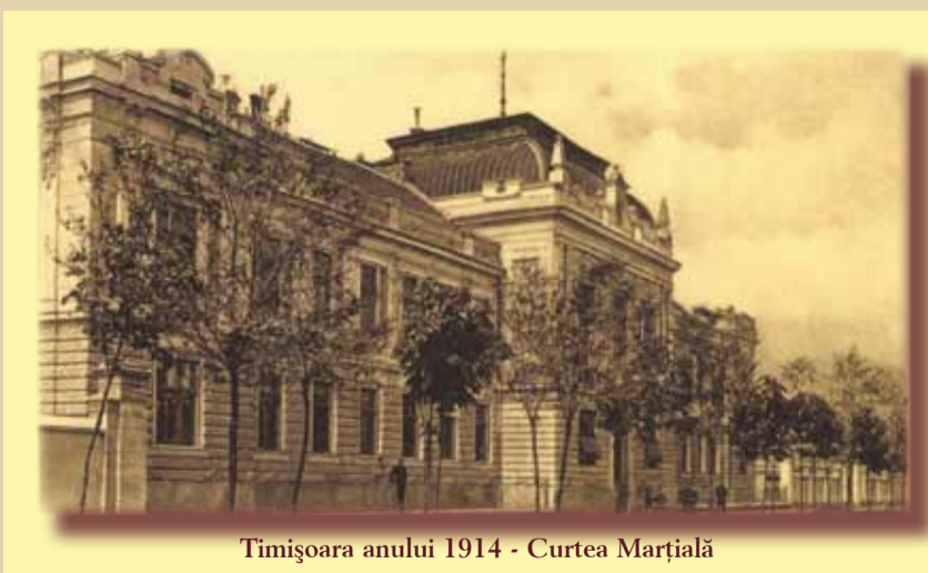
Timișoara anulului 1914 - Curtea Marțială

Unul dintre cele mai stranii episoade din viața orașului de altădată s-a consumat în fața palatului Mercy. Pe vremuri, aici erau adăpostite instituțiile juridice și alături era și camera de tortură, între timp, vechea clădire a fost demolată și ridicată cea de azi, iar locul de azi al sediului vechi B.C.R. era un teren viran. Într-o bună zi, armata a ocupat acest teren, l-a înconjurat cu sârmă ghimpată și a vrut să-și ridice aici închisoarea militară. A doua zi s-au aflat față-n față armata și poliția, gata să tragă una într-alta. Cu greu a fost dezamorsat conflictul, și doar după ce primăria a promis armatei că va construi un corp special de clădiri pentru curtea marțială și pentru închisoarea militară. Așa se face că pe terenul din actuala stradă Popa Șapcă, în ziua de 3 octombrie 1906, încep lucrările de construcție. Peste un an are loc inaugurarea edi-