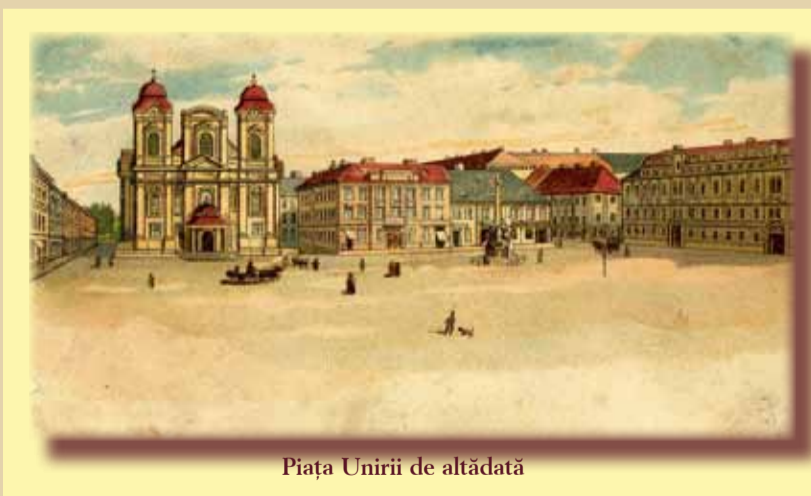
Piața Unirii de altădată