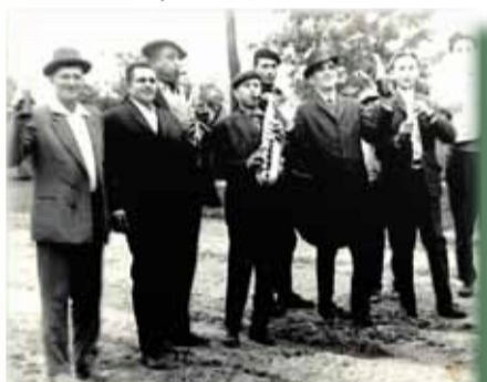
Ruga pe vremuri

Femeile mai în vârstă stăteau pe scaune, în fața lor tinerele fete în costume naționale, iar cele măritate