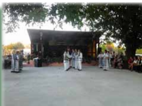
Ruga la Căminul Cultural în zilele noastre

Ziua a doua, era și mai frumoasă. Ruga debuta la ora 9 dimineața cu parada cailor și a căruțelor împodobite și pline cu băieți și fete urmați de muzică, iar în spate o platformă cu fotbalistii stând în picioare și chiuind, scoțând astfel la porți toată lumea din comună. După amiază, la terenul de fotbal aveau loc meciuri cu satele vecine. La meciurile de fotbal era în-