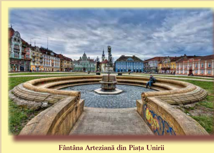
Fântâna Arteziană din Piața Unirii

În secolele trecute, apa potabilă a fost una dintre problemele majore ale Primăriei timișorene. Inițial, s-a încercat aducerea apei prin conducte. Mai apoi, a început forarea de puțuri în interiorul Cetății. Apa nu era deloc bună. Trebuiau găsite adâncimea și straturile freatice potabile, pentru ca orașul să beneficieze de apă. Zeci și zeci de fântâni sunt săpate în locuri publice, în curțile clădirilor militare, ecleziastice și civile din Cetate. Experiența asediului din anul 1849 i-a făcut precauți pe orașeni. Mai aproape de noi, cam acum un veac și ceva, Primăria îl aduce ca meșter fântănar pe Julius Seydl din Vârșeț. În 1890, meșterul începe să foreze în Piața Unirii, căutând pânza de apă freatică. Timp de patru ani, cercetările sunt fără rezultat; apa nu poate fi bătută. Gurile rele ale vremii spuneau că meșterul nu sapă unde trebuie. Mai târziu, după zeci de ani, s-au găsit țevi de foraj în curtea unor