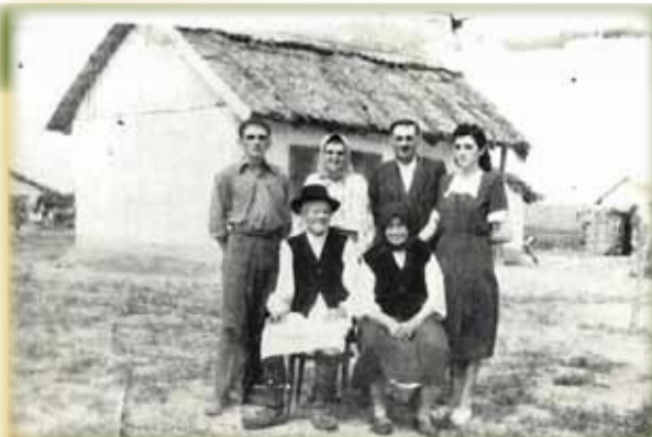
Familie din Voiteg în Bărăgan

Departate de-a lor vatră De dragul lor cămin Sub paza nemiloasă Tânjind s-ajungă acasă Ei n-au lăsat să spună Credința din străbuni Ajunși în libertate Opreliști sfărâmate O palidă lumină O flamă de tăciuni.