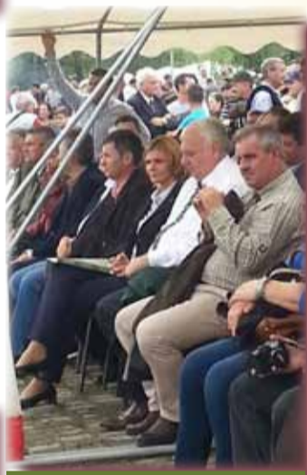
Oaspeți de fală la Bata

La evenimentul, care a fost onorat de un public extrem de numeros, au putut fi întâlnite personalități ale vieții politice românești, scriitori, artiști, conducători de administrații locale.