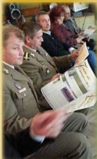
„Banatul” jurnalul fanion al Uniunii, lecturat de ofițerii Țării Banatului.

Primăria Municipiului Caransebeș, Cercul Militar Caransebeș, Casa de Cultură „George Suru” și Biblioteca Municipală „Mihail Halici” a organizat în data de 25 septembrie, în sala de festivități a Cercului Militar Caransebeș, vernisajul expoziției