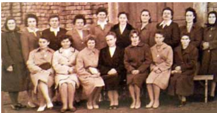
Corul de femei din Iohanisfeld - mijlocul secolului XX

Până în anul 1968 a funcționat atât primăria Otelec, cât și primăria Iohanisfeld. Cea din urmă a fost desființată. Din anul 1968 satele au aparținut comunei Uivar. Din data de 09.05.2008 s-a realizat un obiectiv foarte important pentru cele două foste comune și anume reînființarea comunei Otelec după un efort enorm depus de comunitățile locale pe