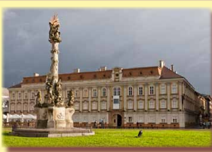
Palatul Baroc din Piața Unirii

Palatul este cunoscut sub mai multe denumiri (Comitatshaus, varmegyháza, casa președintelui; în ultimii ani s-a încetățenit numele de palat baroc, care corespunde stilului arhitectonic al clădirii). Oficial, palatul există din anul 1754. În realitate, pentru cei care l-au vizitat, este limpede, complexul de azi înglobează și clădiri mai vechi decât cea clădire a oficiului minier din 1733 și caseria militară din 1735, ce sunt extinse în 1754. Edificiul are o formă rectangulară, cu subsol, parter, două etaje și mansardă, plus două curți interioare. Porțile - două la număr - sunt capodopere ale barocului vienez. Echilibrul clădirii este dat și de alternanța dintre ferestre și pilaștrii de pe înălțimea celor două etaje. Jacob Klein /în 1885-6/ adaugă mansarda și feroniera, mărind atractivitatea complexului.