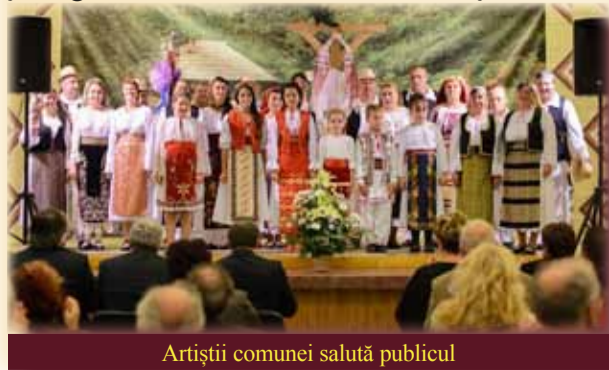
Artiștii comunei salută publicul