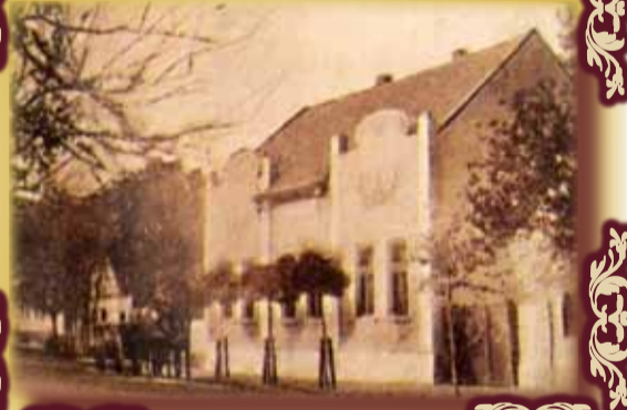
Satul Otelec în anul 1918