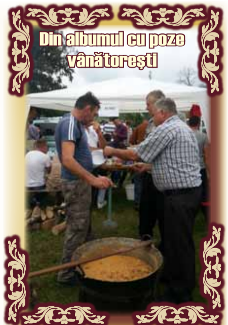
Standul comunei Petriș la Festivalul Vânătorilor din Bata - septembrie 2014