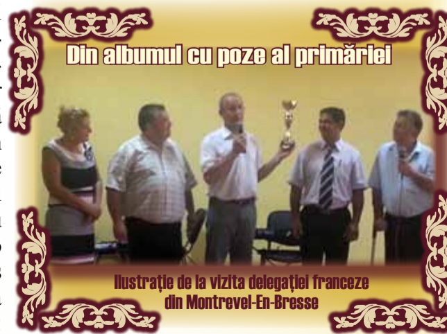
Din albumul cu poze al primăriei