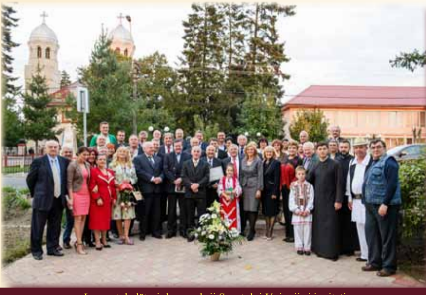
Laureatul alături de membrii Senatului Uniunii și invitați

Învățătorul este un moderator de suflete și caractere. Animați de dragoste, învățătorii îngrijesc florile cele mai frumoase din grădina vieții – copiii, făcând din școală o adevărată grădină de pasiuni, vise și idei mărețe. Anii de activitate alături de elevi au fost și vor rămâne cei mai frumoși ani ai vieții mele. Îi mulțumesc din toată inima bunului Dumnezeu, fiindcă azi, privind în urmă peste bucurii și împliniri, am ajuns să duc la bun sfârșit această muncă. Am rămas