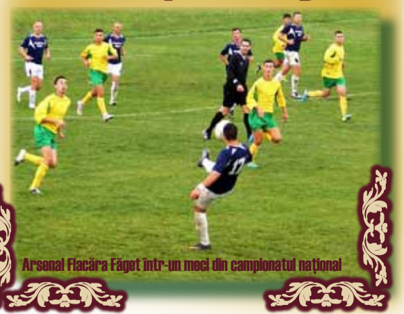
Arsenal Făcăra Făget într-un meci din campionatul național