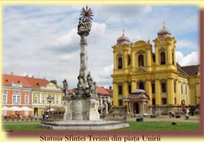
Statuia Sfintei Treimi din piața Unirii

Sus de tot, Sfânta Treime o încoronează pe Fecioara Maria; de jur împrejur, norișori și îngeri. Mai jos sunt statuile profetului David, a Sfintei Barbara și a Sfântului Nepomuk. Și mai jos sunt statuile sfinților Sebastian, cel străpuns de săgeți, Rochus, cel ce apără de ciumă, și Carol Borromeul, călătorul. Pe soclul monumentului se află alte trei scene ce