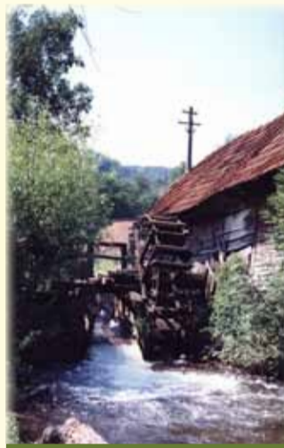
Moara de pe Bega de la Pietroasa

Denumirea provine de la apa carbogazoasă ce păstrează în tot timpul anului o temperatură constantă de 19°, apă ce se găsește într-un bazin circular alimentat de un izvor hipotermal cu un debit puternic. În această frumoasă zonă, din inițiativa patriarhului Miron Cristea, s-a ridicat mănăstirea „Izvorul Miron”. Lucrările au început în 1912, dar s-au terminat abia în 1929 și sfințirea s-a făcut la 20 iulie 1931, având hramul Sfântul proroc Ilie. Este zidită din piatră și cărămidă, având cupolă și turn bine proporționate și este pictată atât în interior, cât și în exterior. În apropiere se află și Păstrăvăria „Balta Caldă” amenajată în 1985 pe o suprafață de 4100 mp. În cele 33 de bazine se află în