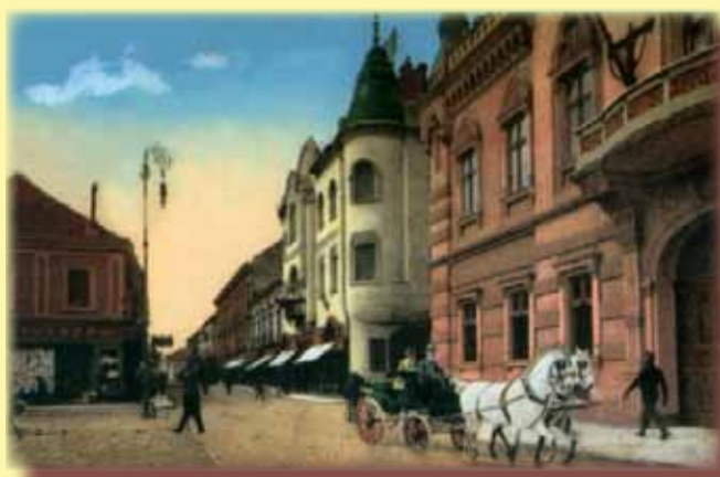
Banca de scont

La nr. 1 al străzii Gh. Lazăr, chiar pe colțul dinspre Piața Unirii și str. V. Alecsandri, se înalță o clădire ce a fost construită în stilul specific al anilor 1900 (Secession sau Jugend) pentru Banca de Scont. Planurile au fost făcute de Marcel Komor și Dezso Jakab, elevii marelui arhitect Odon Lechner, și datează din anii 1905-1906. Clădirea se ridică între 1906 și 1908. Sursa de inspirație a fost folclorul maghiar. Clădirea are parter și două etaje, cu fațade pe două străzi. Cea de pe str. V. Alecsandri, mai scurtă, este mai ornamentală; cealaltă, din str. Gh. Lazăr, mai lungă, este mai sobră. Ideea era de a sublinia elementele arhitectonice ale etajelor, așa încât parterul este sobru. Ferestrele sunt largi, în arc de cerc, cu grilaj de fier forjat. Etajul întâi are casete succesive în care există ferestre, placate cu faianță cu motive fol-