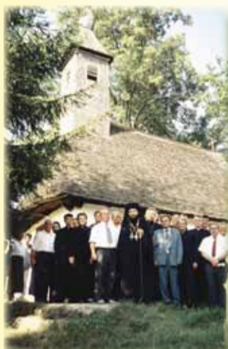
Biserica de lemn din Povergina