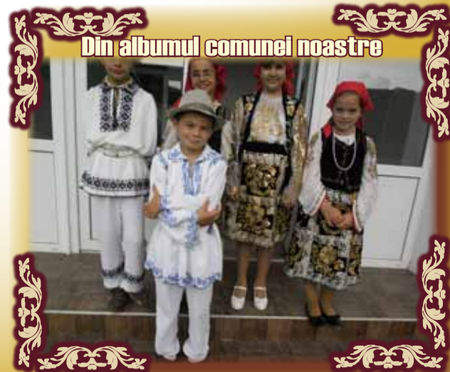
Din albumul comunel noastre

Despre trecerea la Domnul - „Să iubim bine, să iubim frumos, să iubim rana și pe cel ce a făcut rana!”