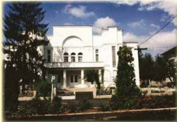
Casa de cultură din Făget

Orașul este situat în partea de nord-vest a munților Poiana Ruscă, pe drumul național 68 A Ilia-Lugoj și linia CFR 212. Dinspre valea