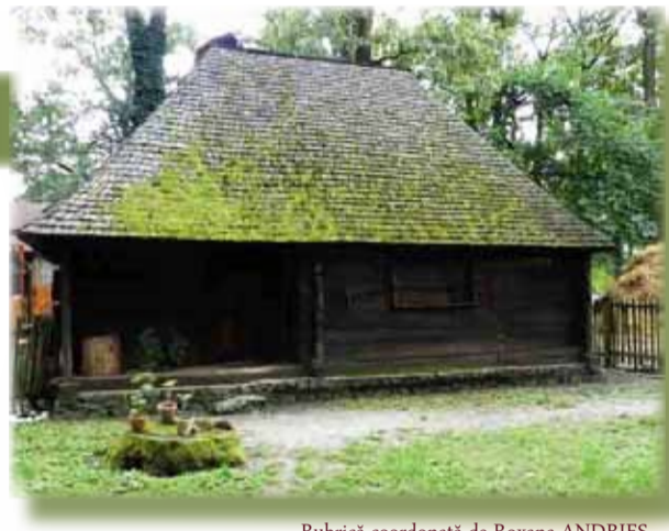
Rubrică coordonată de Roxana ANDRIEȘ

cioplit. Ferestrele erau foarte mici și permiteau păstrarea unei temperaturi constante. În curte se află o construcție anexă – grajdul pentru vite și șura. De asemenea există un coteț și o cocină.