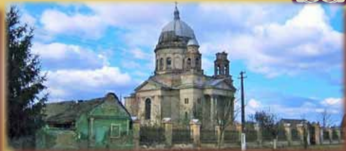
Biserica din Bobda, fost mausoleu al grofilor Csavossy și biserică romano-catolică, astăzi părăsită!