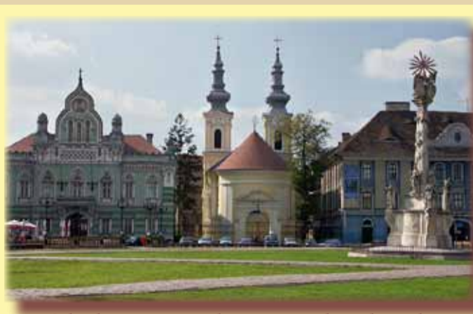
Palatul episcopiei ortodoxe - vicariatul ortodox sârb