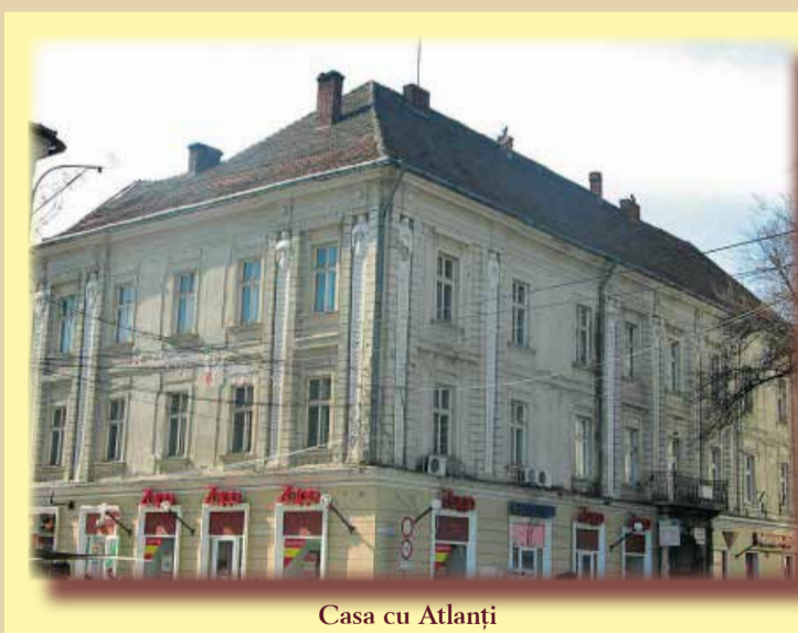
Casa cu Atlanți