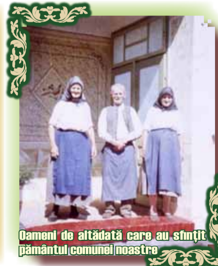
Oamenii de altădată care au sfințit pământul comunei noastre

Cel care mărește pe tată va avea viață lungă și cel care se teme de Domnul cinstește pe mama sa.