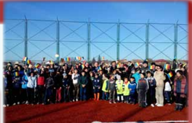
Cei mari și cei mici au ținut să immortalizeze inaugurarea terenului de sport