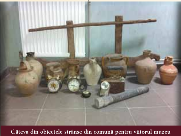
Câteva din obiectele strânse din comună pentru viitorul muzeu

▶ Nu! Rămășițele comunismului persistă, mai ales în mediul rural, iar eu, personal, cred că se va schimba ceva doar pentru generațiile născute după anul 2000 pentru că ei vor înțelege democrația la nivel european, nu românesc. Generația mea e una de sacrificiu, asemeni altora. Am trăit