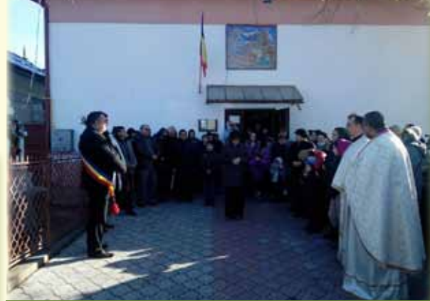
Administrația locală în mijlocul cetățenilor, de Ziua Națională