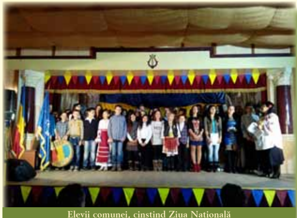
Elevii comunei, cinștind Ziua Națională

Dragi concetățeni, de Ziua Națională a României trebuie să cinștim faptele înaintașilor noștri și din respect pentru memoria lor, ziua de 1 Decembrie, trebuie să ne găsească uniți. Un popor este puternic atunci când este unit și în aceste momente trebuie să fim uniți în jurul interesul național, în jurul viitorului comunei noastre”, a subliniat în discursul