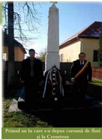
Primul an în care s-a depus coroană de flori și la Cerneteaz

O magiere a celor care s-au jertfit pentru România Mare a continuat la orele prânzului la Căminul Cultural din centrul de comună prin cântece și poezii care ne aduc aminte de trecutul glorios, prezentate de elevii școlii din Giarmata. „În fiecare an, de 14 ani, noi sărbătorim Ziua