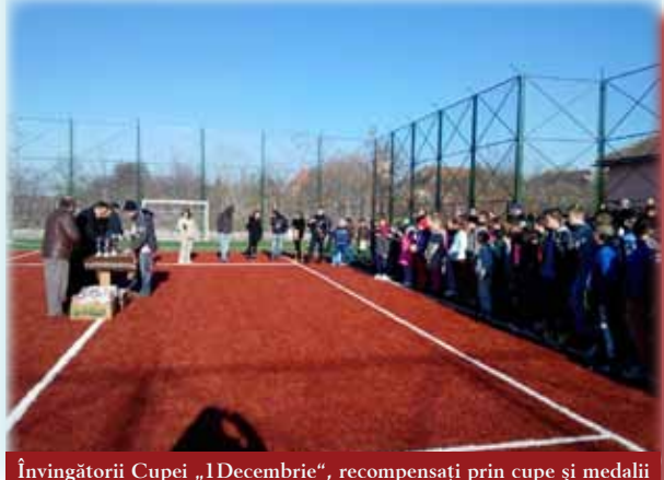
Învingătorii Cupei „1 Decembrie”, recompensați prin cupe și medalii

La orele prânzului, Cupa „1 Decembrie” și-a desemnat câștigătorii la fotbal și la handbal, dar și cei mai buni jucători. Fiecare dintre participanți a primit un pachet cu dulciuri pentru efortul depus, iar pe viitor administrația locală și conducerea școlii își propun să dea o mai mare amploare acestui eveniment și, desigur, premii substanțiale.