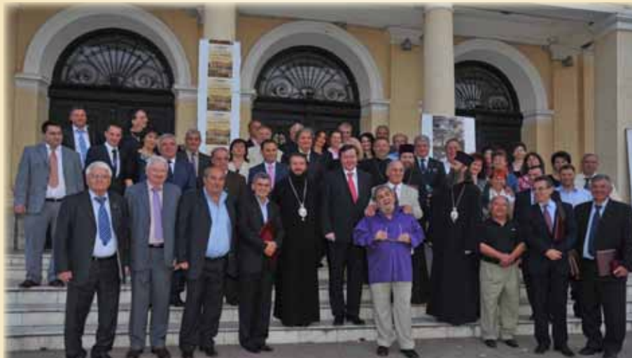
Gala Uniunii Jurnaliștilor din Banatul Istoric, una din reușitele acestui an

este un lucru extraordinar pentru că reușește să promoveze comuna noastră în Banatul istoric, să o facă cunoscută și respectată prin tot ceea ce se întâmplă aici. Cred că în viitor colaborarea se va adâncii, m-am gândit chiar să mărim tirajul la nivel de comună. Uniunea Jurnaliștilor din Banatul Istoric are un loc special în sufletul meu, răspund cu plăcere oricărei solicitări venite din partea sa. Vreau să apreciez modul extraordinar de abordare al acțiunilor Uniunii, pentru că ea promovează oameni obișnuiți la prima impresie, dar, de fapt, fiecare dintre ei este o personalitate apreciată la nivel local și regional.