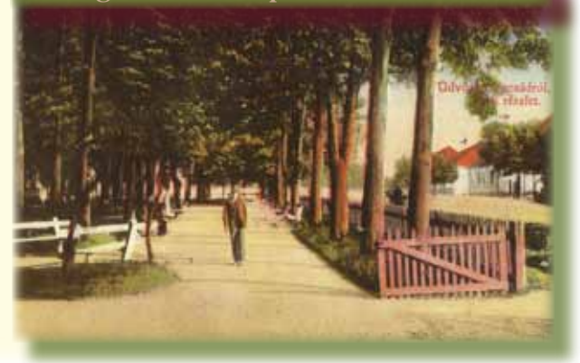
Făgetul la începutul secolului XX

pentru că acestea nu aveau un mesaj mobilizator (revoluționar). Culturnicii făgețeni, dornici de a distruge orice urmă de „cultură burgheză”, au intrat cu „elan revoluționar” și cu coșuri de nuiele și în bibliotecile societăților și reuniunilor culturale ce desfășurau o activitate remarcabilă în perioada interbelică, încredințând nemiloaselor flăcări cărți și publicații reprezentative pentru cultura românească și universală. Rând pe rând toate asociațiile și societățile culturale existente la Făget au fost desființate, în ciuda faptului că ele se remarcaseră de-a lungul anilor printr-o fructuoasă activitate culturală.