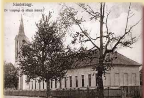
Clădirea Școlii primare din Ferdinandsberg (astăzi Oțelu-Roșu) cu predare în limba germană și maghiară - 1930

Valea Bistrei are trăsături ce definesc echilibrul dintre diferite influențe religioase,