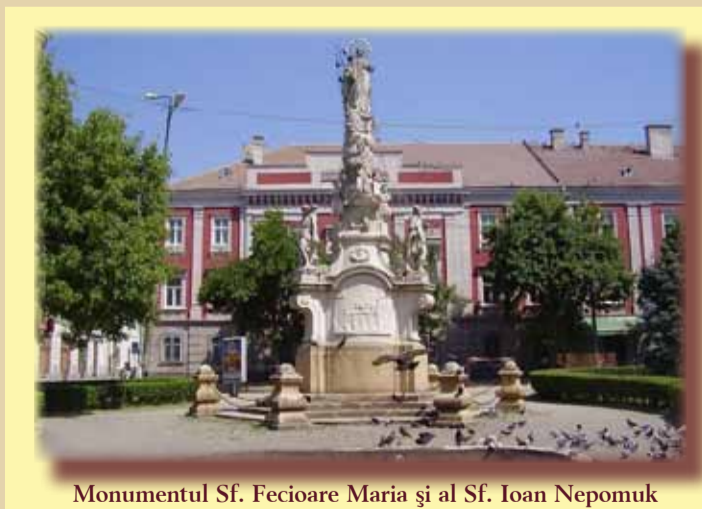
Monumentul Sf. Fecioare Maria și al Sf. Ioan Nepomuk

Statuia, în stil rococo, a fost comandată sculptorilor vienezi F. Blim și E. Wasserburger în anul 1753 și executată în 1756, an când a avut loc și amplasarea în piața