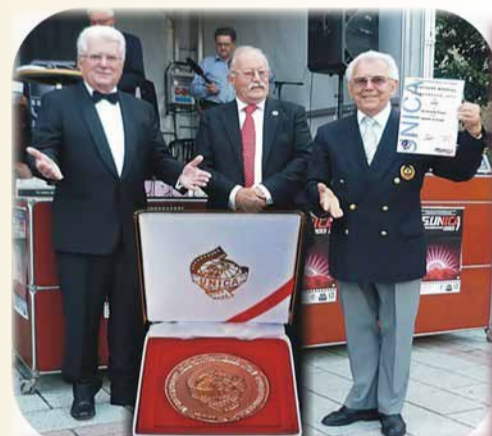
Inmânarea premiilor pentru România de către președintele UNICA Georges Fondeur

VICEPREȘEDINTE AL ASOCIAȚIEI NAȚIONALE A CINECLUBURILOR DIN ROMÂNIA VICEPREȘEDINTE AL LIȚII ASOCIAȚIILOR ROMÂNNO-GERMANE DIN GERMANIA