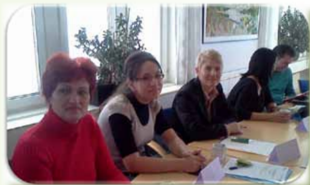
Suedia – octombrie 2013

Școala Gimnazială Nr. 3 Oțelu Roșu este implicată în proiectul DISCOVER YOUR HIDDEN SKILLS (înregistrat cu numărul de referință 13-PM-199-CS-CZ), care-și propune să descopere talentele ascunse ale elevilor. În cadrul acestui parteneriat sunt implicate școli din șapte țări, pe lângă România mai participând: Cehia (țara coordonatoare), Polonia, Turcia, Lituania, Bulgaria și Spania. Prima mobilitate va avea loc în perioada 25-29 noiembrie 2013 la Ujezd – Cehia.