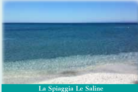
La Spiaggia Le Saline