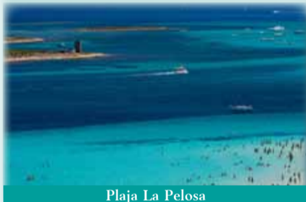
Plaja La Pelosa