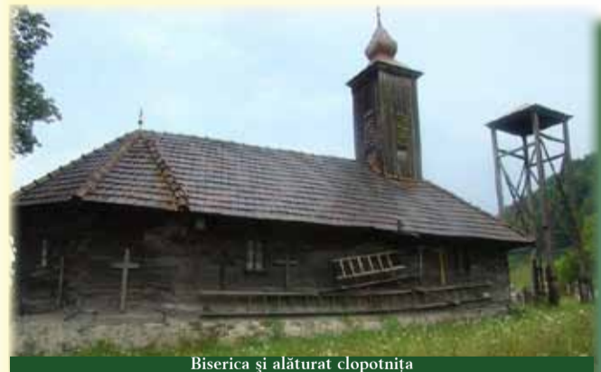
Biserica și alăturat clopotnița

În localitate a fost consemnată existența unei vechi biserici situată pe „Dâmbul bisericii” unde era și cimitirul. În descripția din 1755, satul Corbești avea 15 case iar locuitorii frecventau lăcașul de cult din Petriș, pentru că nu existau biserică și preot în sat.