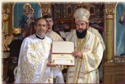
P.S. Episcop Lucian la Obreja (2012)

Duminică, 15 septembrie 2013, ca în fiecare an, a avut loc un eveniment religios deosebit – Adunarea Oastei Domnului , care a antrenat toată comunitatea. Împreună cu membrii credincioși din Oastea Domnului am hotărât încă din anul 1990 să revenim la