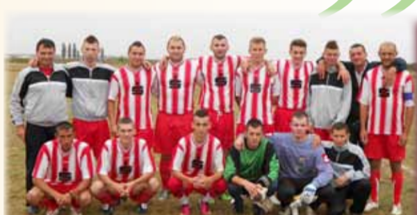
Echipa de fotbal FC Cenei-seniori

De unde atașamentul dumneavoastră față de fotbal?