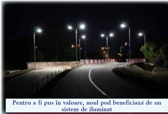
Pentru a fi pus în valoare, noul pod beneficiază de un sistem de iluminat

Istoria podului nou este la fel de complexă ca cea a „Podului de Cărămidă”, după cum ne explică domnul primar Virgil Bunescu. A început pe vremea domnului Roșianu prin tentativa de a reabilita vechiul pod, de a construi unul nou. În mandatul domnului Delvai, acesta a semnat un contract care ducea la construcția unui nou pod. Iată, acum, în mandatul domnului primar Virgil Bunescu s-au finalizat ambele proiecte. „Podul nou a avut o istorie destul de zbuciumată, cu mici transformări de proiect, dar, este un pod frumos, realizat bine, destul de aspectuos și, sper să fie peste timp rezistent, pentru mai multe generații. Este realizat doar cu bani din bugetul comunei Giarmata, iar costurile pentru ridicarea sa au ajuns aproape de 7 miliarde. Construcția noului pod a atras și un eveniment mai deosebit. În proiectul original, era prevăzută demolarea podului vechi pe considerente de siguranță, în caz de inundații. Am înțeles apelul cetățenilor din Cerneteaz, dar era și o voință a mea să-l păstrăm. Mai mult decât atât, mi se părea normal să-l aducem într-o stare civilizată, într-o stare în care să poată fi privit și folosit de către pietoni, pentru recreere. Structura de rezistență a fost refăcută, apoi fiecare cărămidă curățată, iar fragmentele lipsă înlocuite. Ne-am