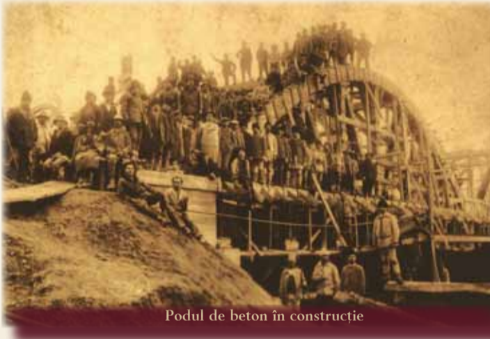
Podul de beton în construcție

La 26 septembrie 1935 conducerea comunei și-a stabilit principalele obiective: construirea unui pod peste Bega pe drumul județean Făget-Birchiș, refacerea drumurilor județene Lugoj-Coșevița, înființarea unui dispensar și înzestrarea lui cu medicamente necesare pentru populația din zonă, procurarea unui selector de trifoi și a unei semănători de grâu.