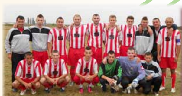
Echipa de fotbal FC Cenei-seniori

De unde atașamentul dumneavoastră față de fotbal?