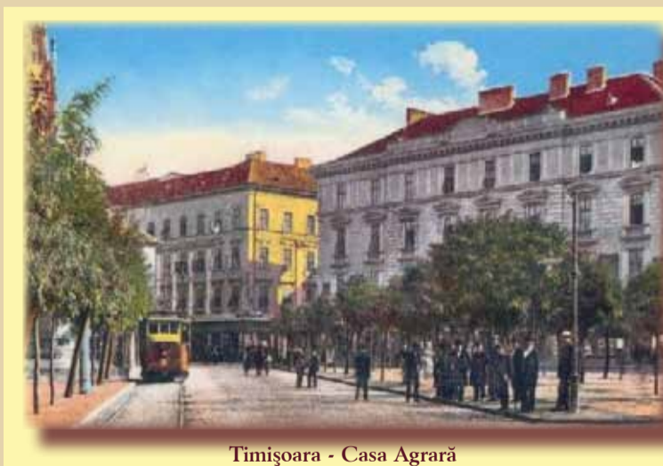
Timișoara - Casa Agrară

În vechea piață de paradă - azi Libertății - printre clădirile militare se numără și Garda Principală (Militar Hauptwache). Clădirea avea un etaj cu arcade mari și două turnuri la intrare, iar la subsol - depozitele de muniții. De aici plecau în gardă soldații ce apărau cetatea Timișoarei de odinioară. Era unul dintre cele mai urâte locuri, căci, aici, cetățenii care nu au ascultat ordinele comandantului militar al cetății erau duși și „tratați” cu toată severitatea. Mărturii vechi spun că pașnicii orășeni preferau să treacă pe oriunde, dar nu prin fața clădirii, așa că ocoleau piața. Dar vremurile acelea au apus de mult. Și au venit vremuri noi: Timișoara se transformase într-un puternic centru economic, comercial și financiar. Se înființaseră și o mulțime de bănci, societăți de economii și asigurări. În anul 1869 apare Casa Agrară de Economii, din Timiș (Temescher Agrar-