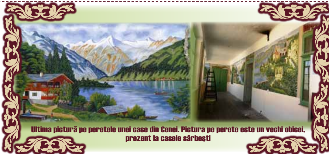
Ultima pictură pe peretele unei case din Cenei. Pictura pe perete este un vechi obicei, prezent la casele sârbești

Biserica este declarată monument istoric.