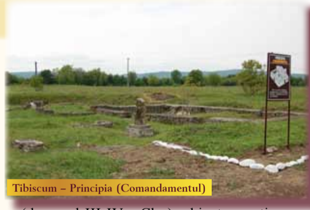
Tibiscum – Principia (Comandamentul)

Muzeul Județean de Etnografie și al Regimentului de Graniță Caransebeș