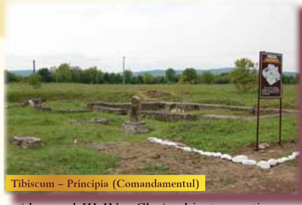
Tibiscum – Principia (Comandamentul)

Muzeul Județean de Etnografie și al Regimentului de Graniță Caransebeș