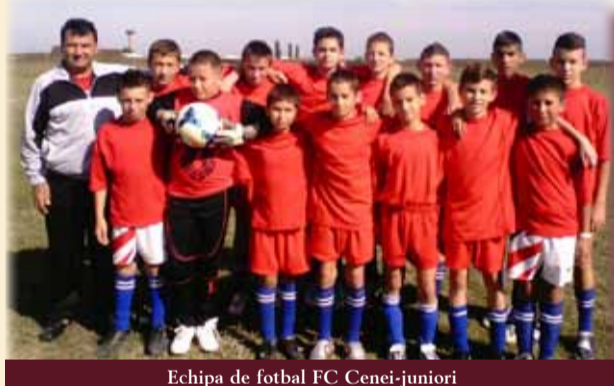
Echipa de fotbal FC Cenei-juniori

Ce activități mai desfășurați în afara locului de muncă și al mandatului de consilier local?