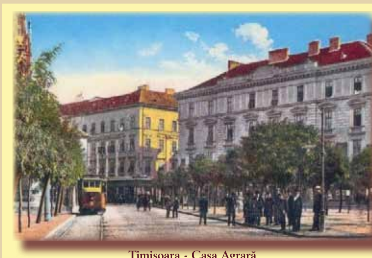
Timișoara - Casa Agrară

În vechea piață de paradă - azi Libertății - printre clădirile militare se numără și Garda Principală (Militar Hauptwache). Clădirea avea un etaj cu arcade mari și două turnuri la intrare, iar la subsol - depozitele de muniții. De aici plecau în gardă soldații ce apărau cetatea Timișoarei de odinioară. Era unul dintre cele mai urâte locuri, căci, aici, cetățenii care nu au ascultat ordinele comandantului militar al cetății erau duși și „tratați” cu toată severitatea. Mărturii vechi spun că pașnicii orășeni preferau să treacă pe oriunde, dar nu prin fața clădirii, așa că ocoleau piața. Dar vremurile acelea au apus de mult. Și au venit vremuri noi: Timișoara se transformase într-un puternic centru economic, comercial și financiar. Se înființaseră și o mulțime de bănci, societăți de economii și asigurări. În anul 1869 apare Casa Agrară de Economii, din Timiș (Temescher Agrar-