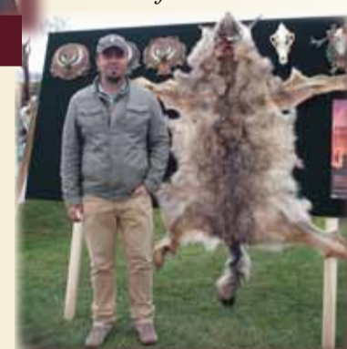
După recordul național al lui Nicolae Ceașescu, acest lup ocupă locul doi în clasament

Pe lângă trofee, pe lângă ceaunele aburinde, miile de vizitatori și vânători prezenți au putut să urmărească o demonstrație cu șoimi, după care a avut loc degustarea produselor vânătoarești și spectacolul folcloric, minuțion pregătit de Primăria și Consiliul Local Bata. Evenimentul a fost organizat de Consiliul Județean Arad, prin Centrul Cultural Județean Arad, Asociația Județeană a Vânătorilor și Pescarilor Sportivi și, evident, Primăria comunei Bata.