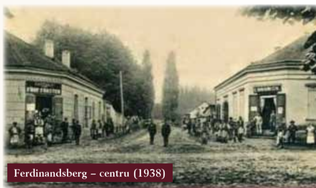
Ferdinandsberg - centru (1938)

Avântul economic ce s-a manifestat după 1850 a creat premisele extinderii bazei tehnico-materiale a uzinei Ferdinandsberg, ceea ce a impus atragerea de noi brațe de muncă. Foștii coloniști se stabilesc definitiv pe aceste teritorii. În a doua jumătate a secolului al XIX-lea, în rândul populației statornice la Ferdinandsberg, pe lângă germani s-au mai aflat și alte naționalități: slovaci, cehi, maghiari, italieni etc. Emigrarea italienilor în Banat, mai precis în Culoarul Bistrei, s-a derulat în mod organizat pe baza unor pașapoarte de lucru eliberate de către Ministerul de Afaceri Externe al Italiei. Populația slovacă și cehă din zonă este rezultatul colonizărilor habsburgice și maghiare. Dezvoltarea industriei în ritm susținut impunea asigurarea forței de muncă, de aceea s-au recrutat muncitori din zonele limitrofe. Deoarece pe Valea Bistrei colectivizarea agriculturii a fost redusă, nu s-au găsit brațe de muncă la nivelul cerințelor impuse de dezvoltarea uzinei. Astfel au fost aduși în localitate tineri cu precădere din județele Olteniei și Moldovei.