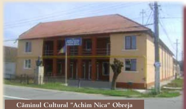
Căminul Cultural „Achim Nica” Obreja

Vechea clădire a Primăriei comunei Obreja, situată în centrul satului, a fost dărâmată în toamna anului 1982. Spațiile existente nu mai corespundeau, aici funcționând și postul de miliție, poșta, asociația pomicolă și remiza de pompieri voluntari. Lucrările de dărâmare a vechii primării și construirii noii clădiri s-au făcut prin muncă voluntară de săteni.