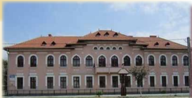
Școala cu Troiță

În anul 1953 ia ființă învățământul liceal, iar școala