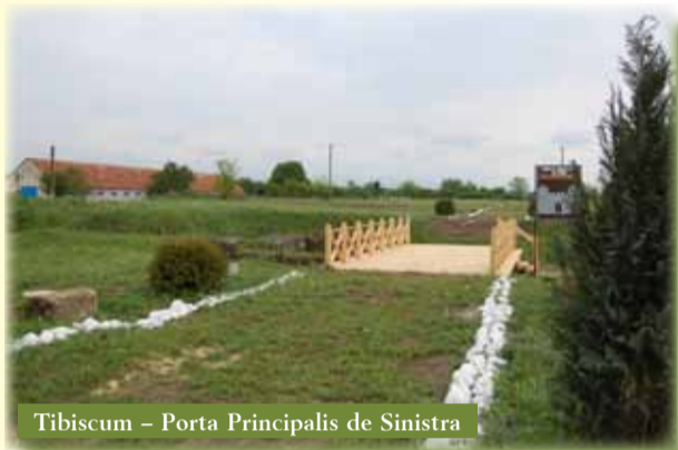
Tibiscum – Porta Principalis de Sinistra

Muzeul Județean de Etnografie și al Regimentului de Graniță Caransebeș