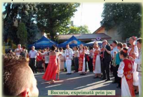
Bucuria, exprimată prin joc