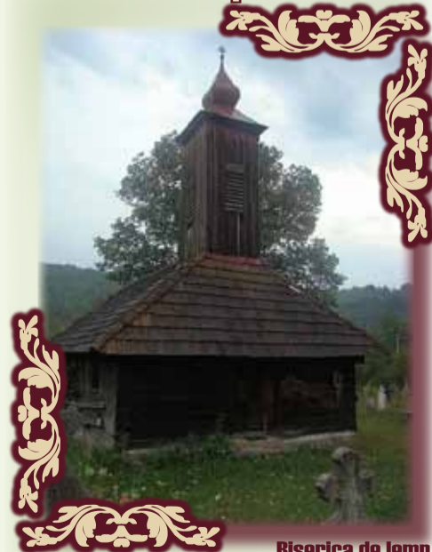
Biserica de lemn din Corbești, monument istoric