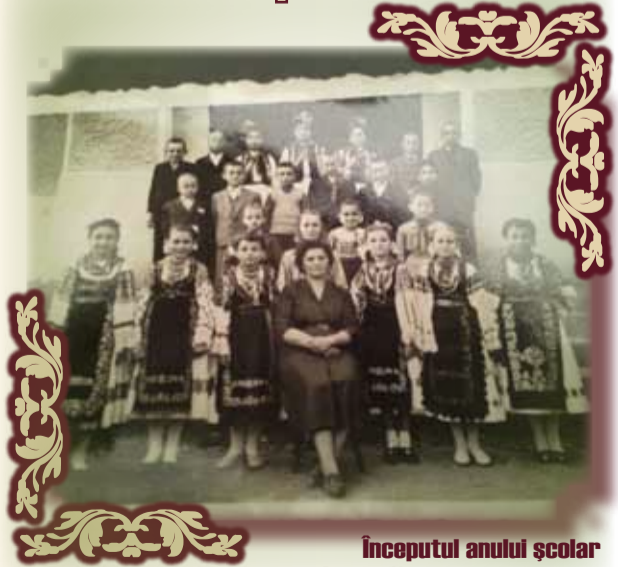
Începutul anului școlar la Bata în urmă cu peste 50 de ani