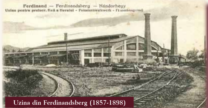
Uzina din Ferdinandsberg (1857-1898)

La sfârșitul secolului al XVIII-lea, viața economică a Banatului a cunoscut o înviore. Se intensifică explorările și exploatarea miniere. Bogățiile pe care le posedau Munții Poiana Ruscă au atras investirea unor importante capitaluri în ramura minieră și metalurgică. O astfel de investiție a fost făcută de către numitul