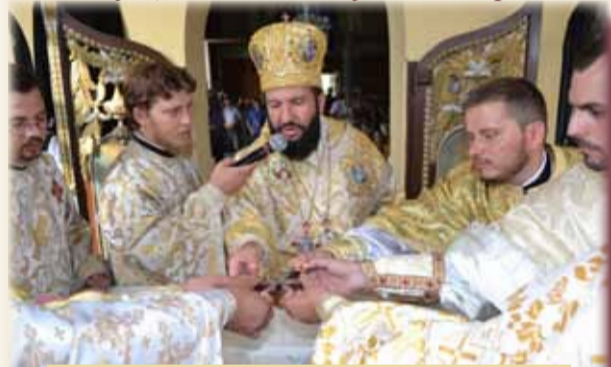
Depunerea sfintelor moaște în noua masă a altarului

Preasfințitul Lucian a fost întâmpinat la