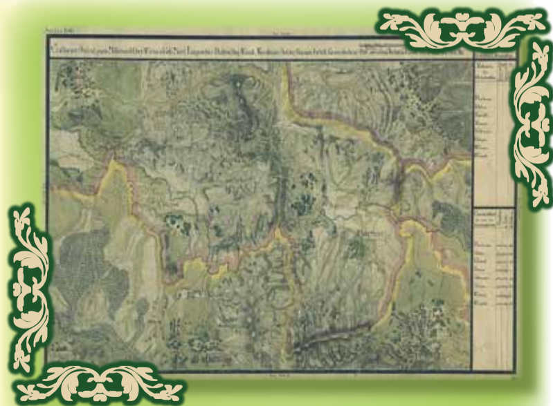
Vermeș în Harta Iosefină a Banatului, 1769-1772

Pentru noul an școlar dorim tuturor copiilor bănațeni, și nu numai lor, mult succes, putere de muncă și capacitatea de a face față cu bucurie tuturor examenelor vieții.