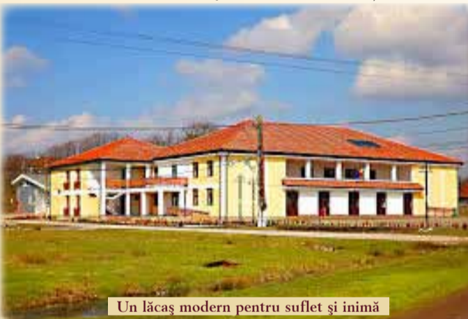
Un lăcaș modern pentru suflet și inimă

► Avem întâlniri periodice cu cetățenii. Ast-