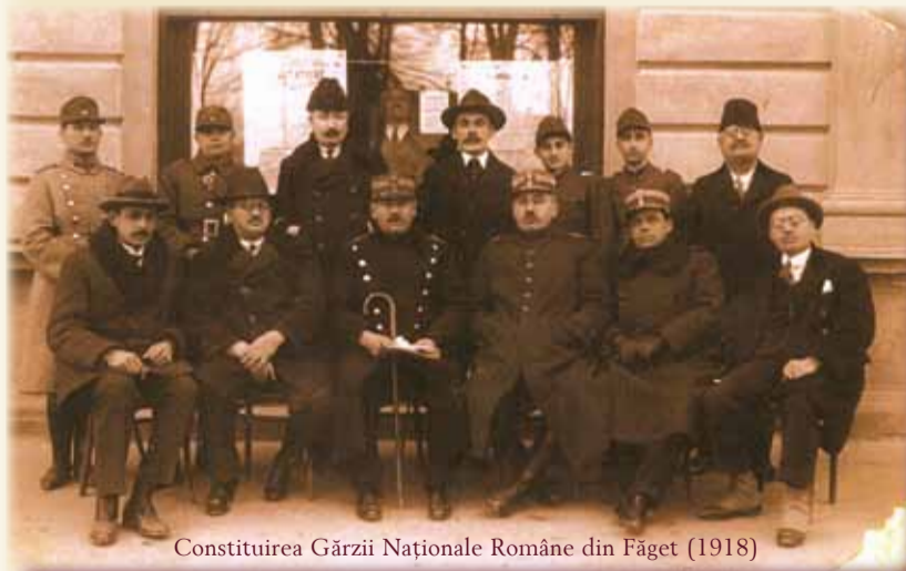
Constituirea Gărzii Naționale Române din Făget (1918)