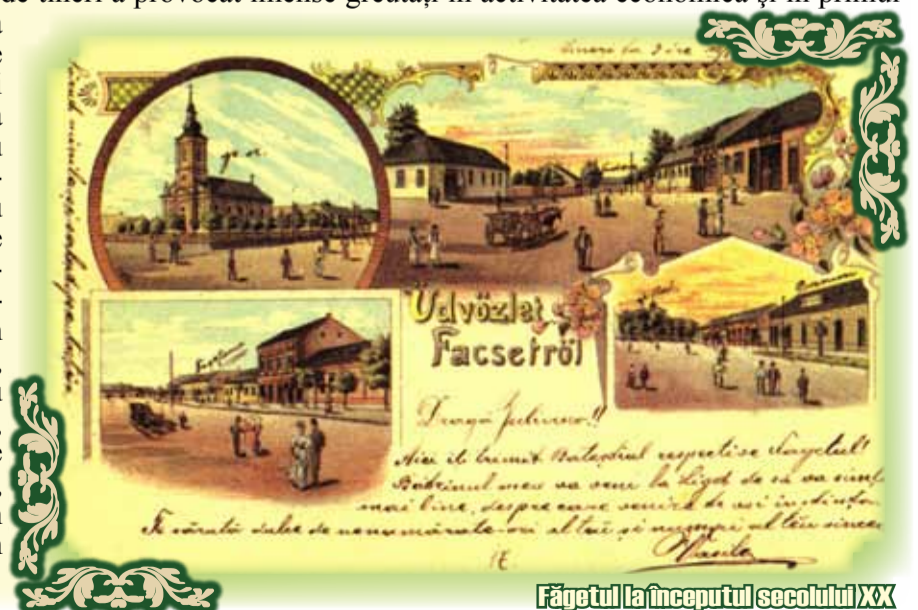
Făgetul la începutul secolului XX