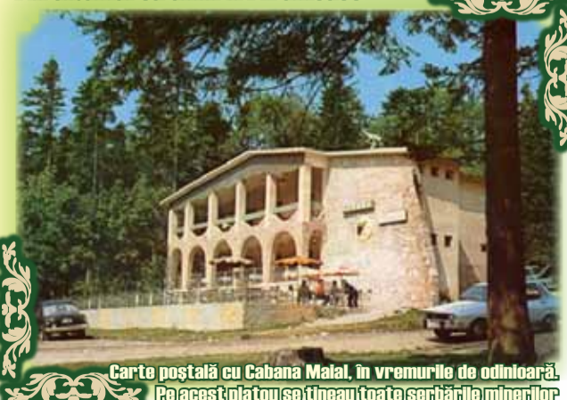
Carte poștală cu Cabana Malai, în vremurile de odinioară. Pe acest platou se țineau toate serbările minerilor