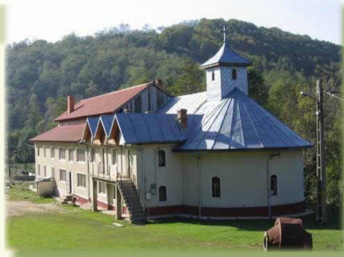
marginea satului Putna, de pe Valea Almăjului.