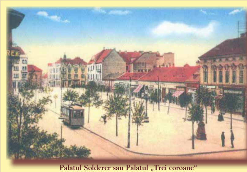
Palatul Solderer sau Palatul „Trei coroane”

Cine mai știe astăzi cine a fost Petru Solderer? Un cetățean pe care locuitorii l-au ales și reales, și iar reales primar al Timișoarei. Administrația imperială l-a destituit, cetățenii l-au reales imediat la loc. Primarul Peter Solderer a fost una dintre figurile proeminente ale Timișoarei din veacul al XVIII-lea. Pe cât de mari succese a avut ca primar, pe atât de multe neazuri a avut în viața privată. După moartea soției rămâne cu o fiică de a căruie educație se îngrijește. Se recăsătorește, dar nu are noroc cu soția, care-l părăsește. Din dorința de a asigura viitorul fetei, Solderer își investește toate economiile - ba mai ia și cu împrumut bani - și construiește o clădire monumentală pe strada Eugeniu de Savoya, colț cu Vasile Alecsandri. Inceputurile construcției datează din vremea ciumei (1739). În anul 1741, când primarul moare, construcția casei