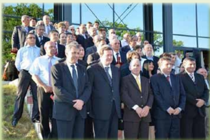
Senatul Uniunii Jurnaliștilor din Banatul Istoric alături de laureații Galei anului 2012

P. S. Intrarea la Gala Premiilor Uniunii Jurnaliștilor din Banatul Istoric din acest an este GRATUITĂ!