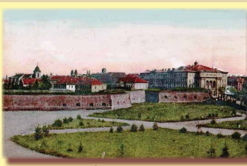
Timișoara anului 1899. În fundal, Biserica Călugărilor Mizericordieni

Aceeași asociație ridică, în continuarea