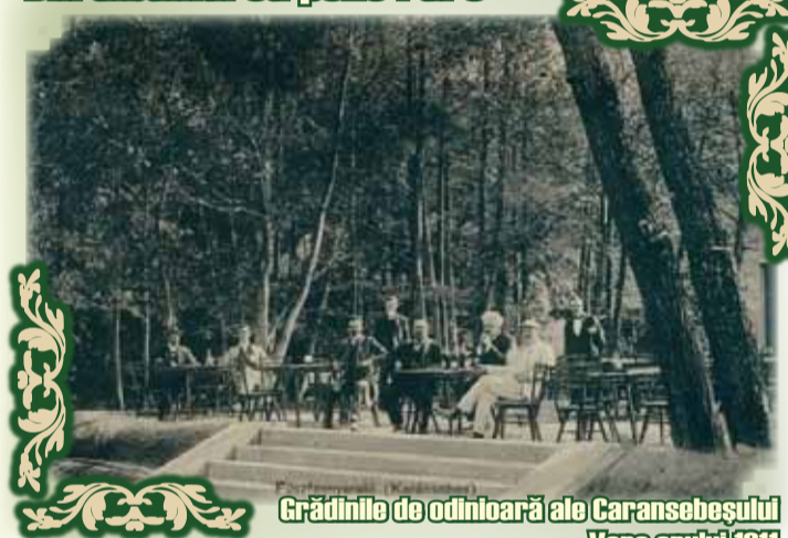
Grădinile de odinioară ale Caransebeșului Vara anului 1911