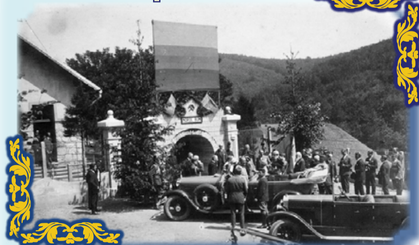
Anina - iunie 1926, oficialitățile orașului nostru de acum 87 de ani, întâmpină pe regele Ferdinand cu regina Maria