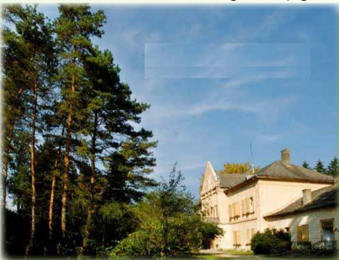
Castelul Mocioni din satul Bulci, comuna Bata

Austria, după luptele de la Sadova și Königsgrätz, fiind silită să iasă din confederația germană, își dă seama că orice tendință de expansiune spre vest îi este imposibilă. Așa că, își îndreaptă privirea spre Răsărit. Trebuia să se