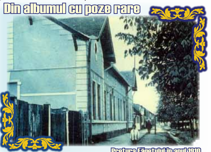
Pretura Făgetului în anul 1910