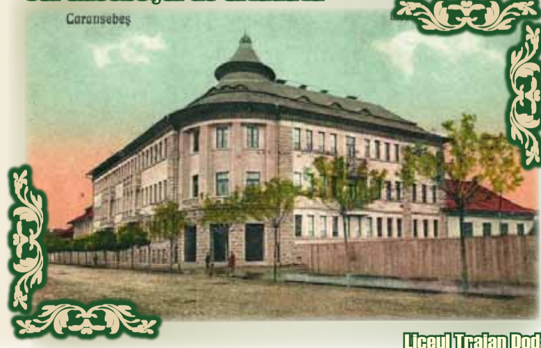
Liceul Traian Doda