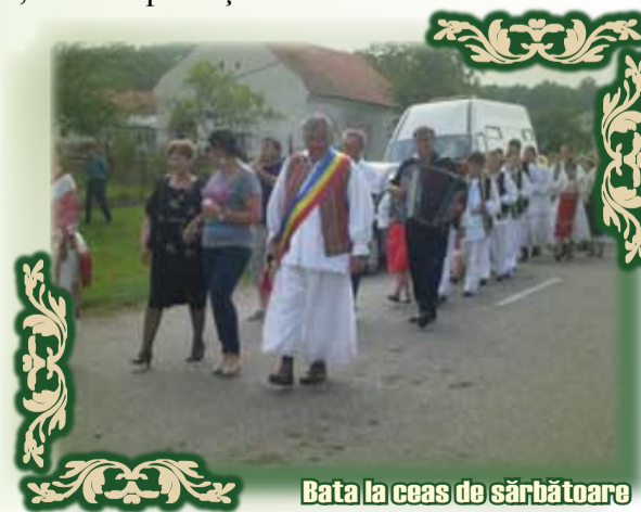
Bata la ceas de sărbătoare

Bata sau Balta, cum o știu moșii și strămoșii noștri, a rămas satul nostru românesc în vremelnicia vremurilor.