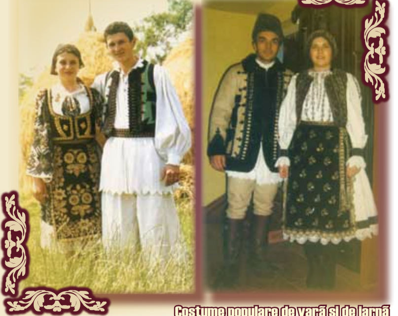
Costume populare de vară și de iarnă