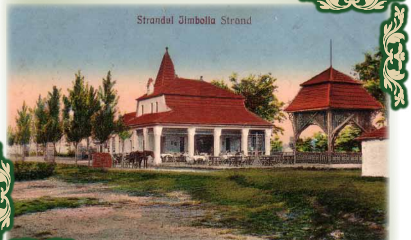
Strandul orașului nostru. Cîndva, demult...