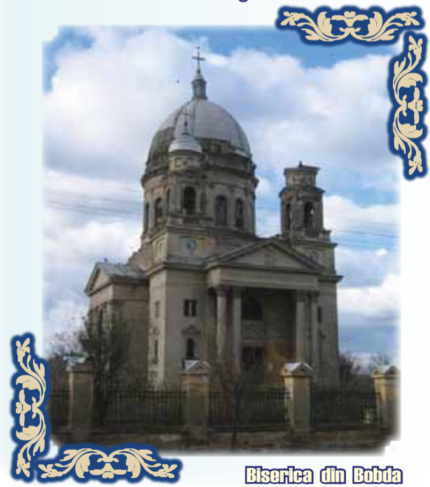
Biserica din Bobda