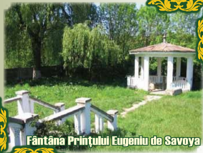
Fântâna Prințului Eugeniu de Savoya